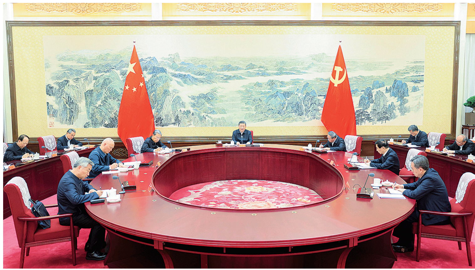
12月26日至27日，中共中央政治局召开民主生活会，中共中央总书记习近平主持会议并发表重要讲话。