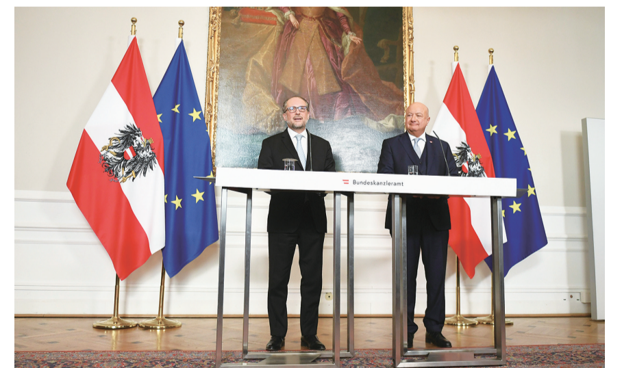
3月3日,在奥地利维也纳,奥地利看守政府总理沙伦贝格(左)在总理府和奥地利人民党党首克里斯蒂安·施托克尔进行权力交接。由奥地利人民党、社民党和新奥地利党三党联合组成的奥地利新一届政府3日宣誓就职,人民党党首克里斯蒂安·施托克尔成为奥地利新总理。