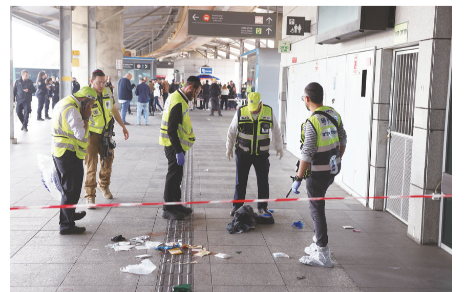
3月3日,中国科学技术大学教授、“祖冲之号”量子计算总师朱晓波(左一)与学生讨论实验结果。记者从中国科学技术大学获悉,近期该校潘建伟、朱晓波、彭承志等成功构建105比特超导量子计算原型机“祖冲之三号”,处理量子随机线路采样问题的速度比目前国际最快的超级计算机快千万倍,再次打破超导量子计算优越性世界纪录。3日国际知名学术期刊《物理评论快报》发表了这一成果,审稿人认为其“构建了目前最高水准的超导量子计算机”。