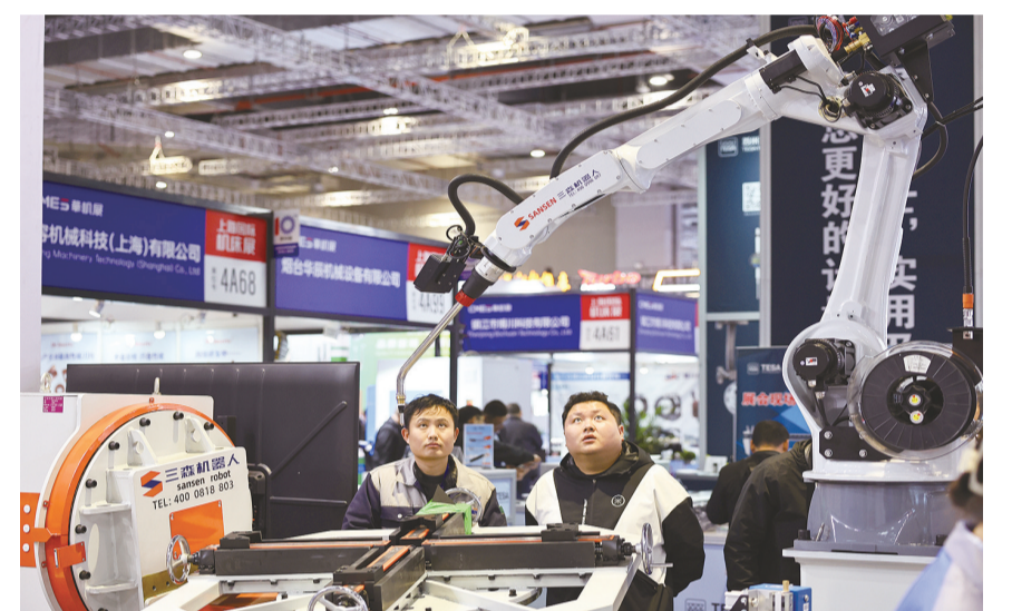
3月3日,参观者在一个进行作业演示的机器人前驻足观看。当日,2025上海国际机床展在国家会展中心(上海)开幕。国内外1200家行业企业参展,聚焦新能源汽车、电子设备制造和航空装备等热门行业加工解决方案,集中展示数控机床核心功能部件、激光加工设备以及磨削钣金工具等产品和新技术。