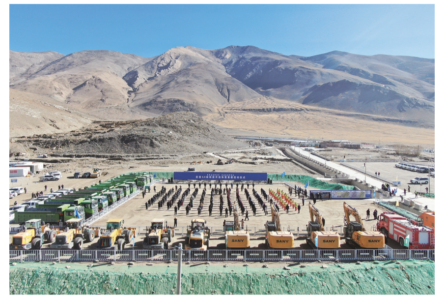
这是3月3日拍摄的灾后恢复重建项目启动仪式现场(无人机照片)。当日,西藏定日6.8级地震8个整村推进村庄灾后恢复重建项目启动仪式在定日县长乡古荣村举行,灾后恢复重建工作正式启动。据了解,此次整村推进的8个村庄包括定日县的长乡古荣村、措果乡野江村、曲洛乡措昂村,以及拉孜县的锡钦乡夏拉苏村等。