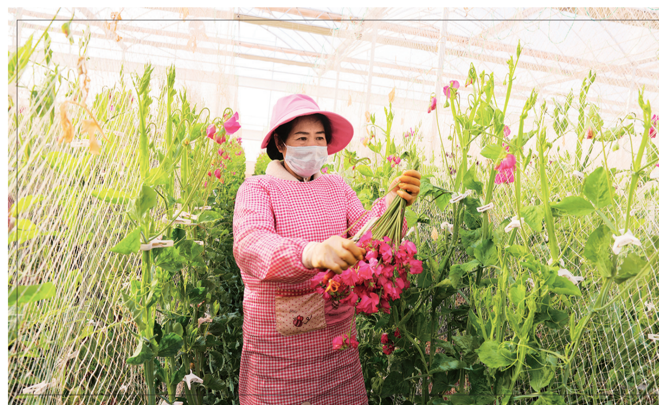
工人在兰桂弥弥现代农业产业园基地内采摘香豌豆鲜花。(摄于3月10日)

安全防线。专项执法行动期间,永平县市场监督管理局依法查获不合格电器、不合格电池、侵权白酒、侵权运动鞋、过期化妆品、过期药品及医用口罩、过期食品等共计600余件。市场监督管理执法人员将这些假冒伪劣商品进行集中堆积,在清点数量之后,在垃圾处理厂采取碾压切碎的方式进行全部销毁,展示了全县市场监管部门打击制假售假工作成效,彰显了维护市场秩序、保障市场经营主体和人民群众合法权益的坚定决心。