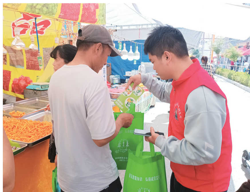
漾濞县地震局党员、志愿者在“二月十九街”物资交流会上开展防震减灾宣传教育活动。(摄于3月17日)