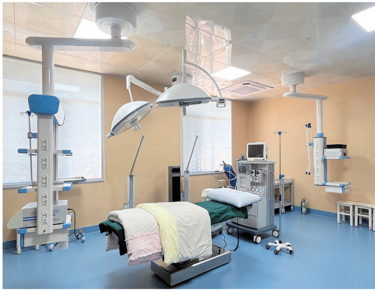
设备齐全的德直乡卫生院手术室,让山区群众在家门口就能享受到高水平的医疗服务。(摄于3月6日)

如今,弥渡县凭借不断完善的“县域医共体一体化”优质资源优势,努力为当地百姓办好家门口满意的医院。无论是专家工作站带来的实地诊疗,还是远程会诊服务实现的隔空问诊,都让患者真切感受到了便捷与安心。