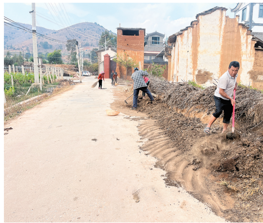
宾川县乔甸镇开展环境卫生大扫除活动,全镇干部职工、各村组党员干部和志愿者齐心协力,对辖区内池塘、沟渠、河道、道路等区域进行清理整治。(摄于3月16日)

建立政法干部个人重大事项变化报备制度,及时了解掌握政法干部工作和生活中的重大事项,对苗头性、倾向性问题及时进行提醒教育,对涉嫌违纪违法问题一律交由纪检监察部门依法依规严肃追责,同时,对干部遇到的问题及时给予必要的关心和帮助,对工作中出现的失实反映在一定范围内给予澄清正名,切实将严管厚爱的要求落到实处,让全体政法干部树牢有为者有位、不为者腾位、乱为者丢位的理念。