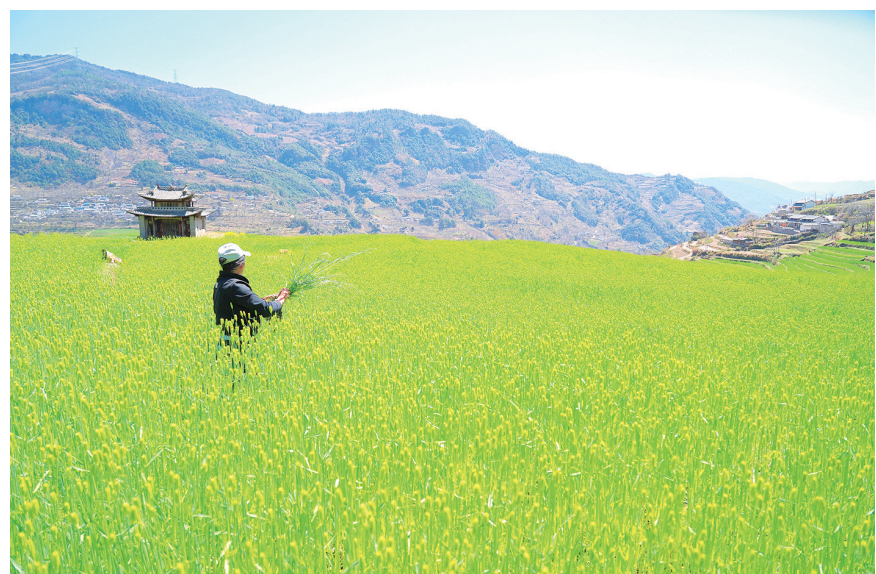
剑川县象图乡一位老农在麦田清理杂草。(摄于3月26日)

连日来，南涧县幼儿园分年级在涧河宋词长廊和南涧公园开展“探自然奥秘、享春日童趣”亲子春游徒步研学活动，让孩子们亲近自然，感知季节变化，进一步开阔孩子们的视野，感受春日的幸福与欢乐。