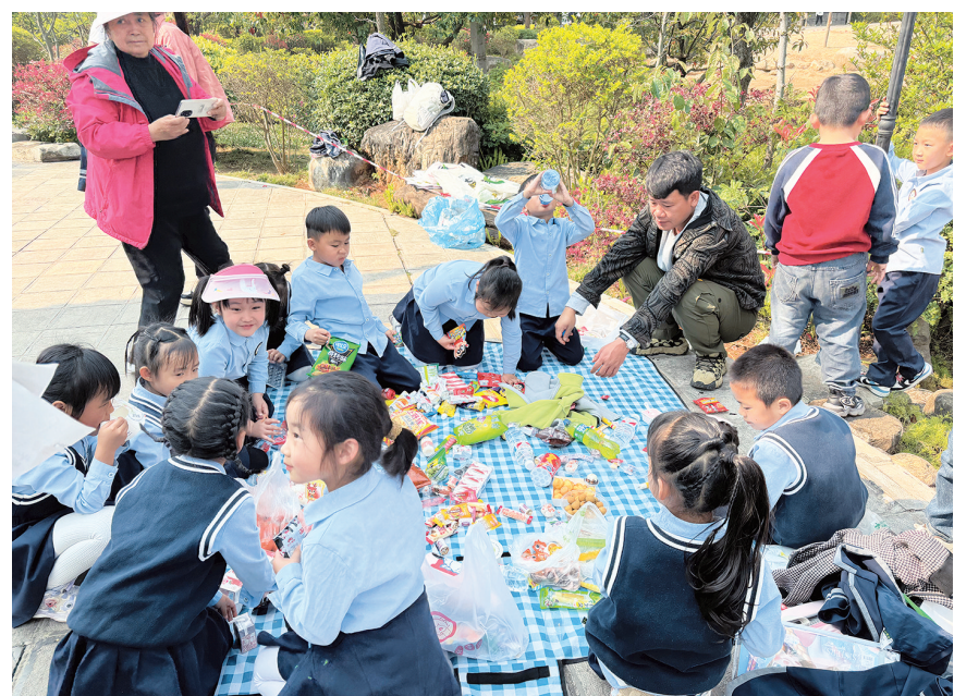
孩子们在南涧县南涧公园休息和野餐。(摄于3月28日)

近年来，巍山县聚焦医疗服务水平提升，强化人才队伍建设，围绕人才的引进、培养与使用三个关键环节持续发力，推动全县医疗卫生事业高质量发展，让患者足不出县就能治病、治好病。