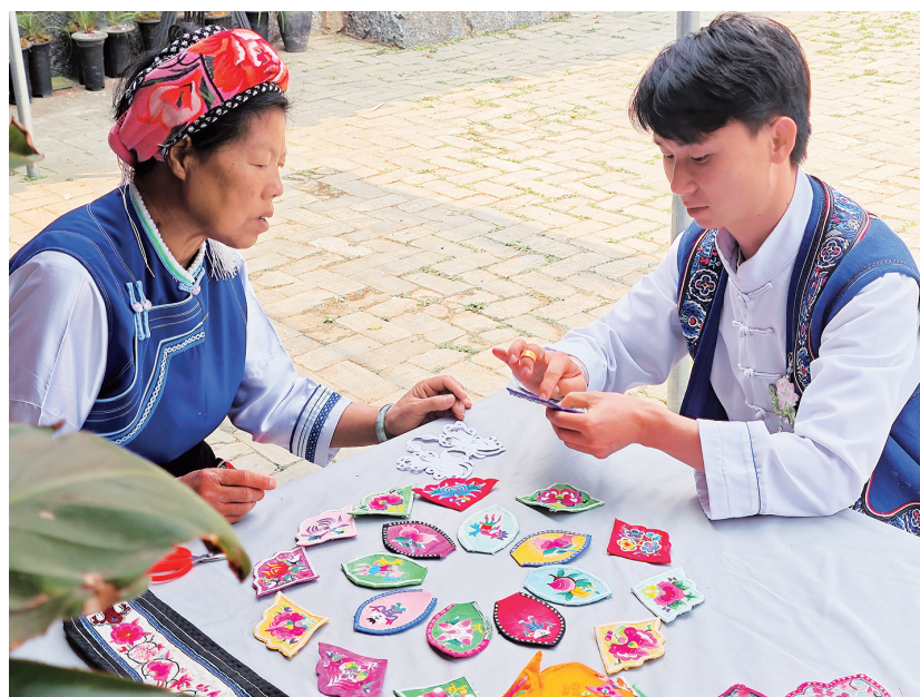
二代非物质文化遗产代表性传承人在交流刺绣技艺心得。