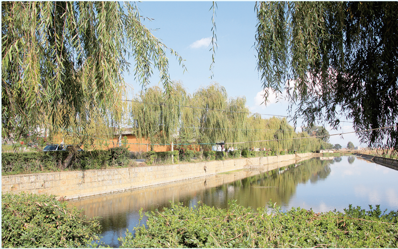
祥云县下庄镇鱼进所村绿化美化一角。（摄于4月2日）

近年来，祥云县坚持生态优先、绿色发展理念，高标准建设美丽乡村，持续推进绿美行动，实现了城乡人居环境绿色宜居。