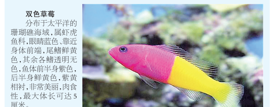
双草莓 分布于太平洋的珊瑚礁海域，属虾虎鱼科，眼睛蓝色，靠近身体前端，尾鳍鲜黄色，其余各鳍透明无色，鱼体前半身紫色，后半身鲜黄色，紫黄相衬，非常美丽，肉食性，最大体长可达5厘米。