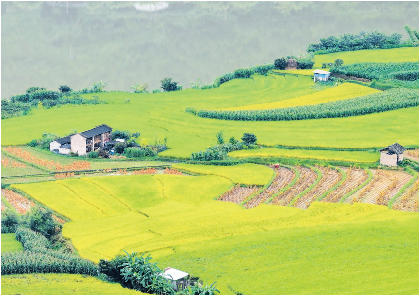
澜沧江畔,黄绿相间的连片水稻生机勃勃。(8月5日无人机航拍图片)