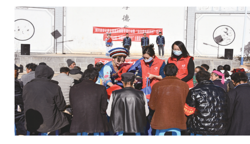
剑川县开展“法治宣传进机关”活动。