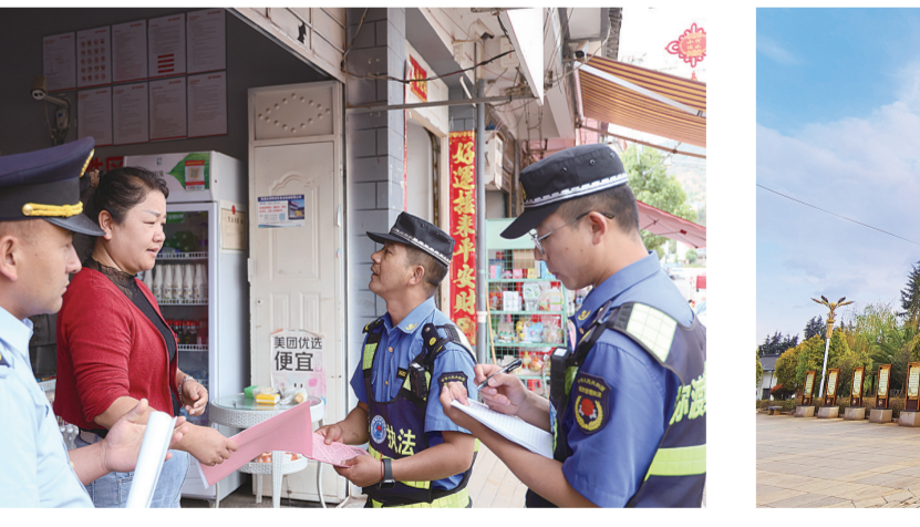
弥渡县综合行政执法局在商铺进行常规检查。