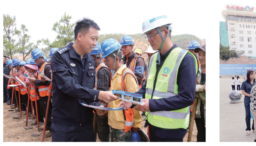
弥渡县公安局在建筑工地进行普法活动。

次办”1314项,“自助办”64项,完善“五级十二同”政务服务事项1370项,发布率为100%,网上可办率达100%。做到中小微企业服务全覆盖。创新实施提前预审、并联审批、容缺办理的“五证同领、送证上门”祥云模式,得到省级充分肯定,并在全州推广,有力推进祥云经济绿色低碳智慧的现代化园区建设,积极拓展服务范围,提升服务能力,优化服务流程,改善服务环境,水电气网“一站式”联动机制服务新办企业办证全过程,实现惠企利民措施从“能办”向“办好”转变。 优化公共服务 提升近商“深度” 持续拓展县乡公共法律服务中心服务范围,加快推进祥云经济公共法律服务体系建设,推动县公证处进驻政务服务中心。实现法、检、公、司、警联系乡镇村(社区)全覆盖,“一村一法律顾问”和公共法律服务机器人全覆盖,打通服务非公经济组织的“最后一米”。 智慧赋能维护和諧稳定。网络化管理健全完善,完成“全科网格”建设,全县1个二级网格,10个三级网格,139个四级网格,1218个五级网格,7049个微网格边界清晰,积极发挥作用。法、检、公、司服务平台融合贯通,“祥云快警”机制落实到位,各类违法犯罪得到有效打击,有力维护全县经济社会和谐稳定。 聚力执法监督 加大重商“力度” 行政执法规范化水平。全面完成综合行政执法体制改革,综合执法和行政执法有机融合,做到执法层级减少和执法力量增加统一,多镇综合执法全面加强。 涉企行政执法质量高效。全面推行“企业安静期”和“综合查一次”,稳步推进行政执法质量三年行动,推广