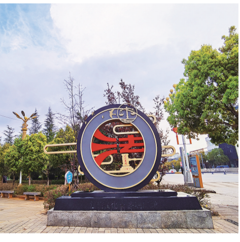
弥渡县法治文化广场。