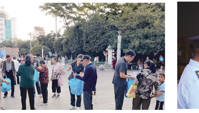
弥渡县人民法院在花灯广场为群众发放法治宣传资料。