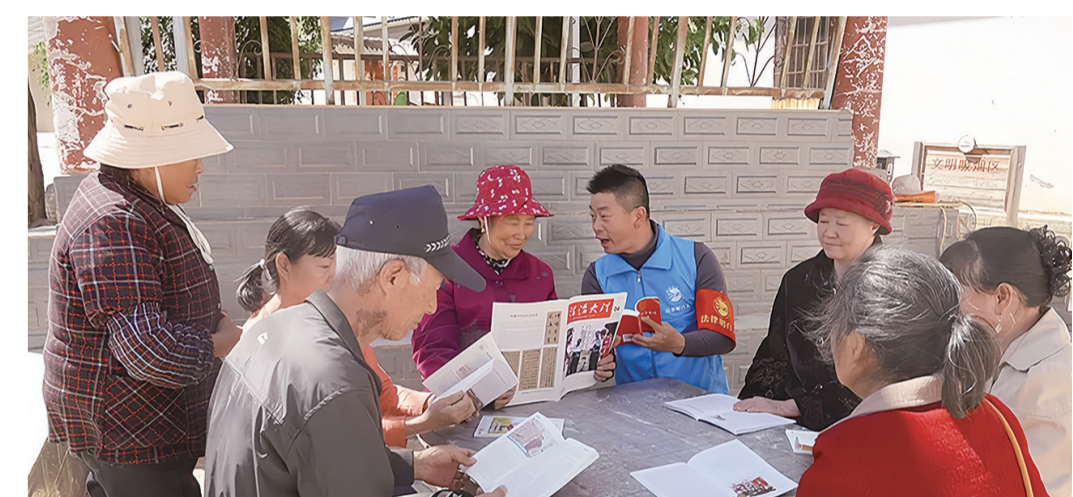
祥云县“法律明白人”进行普法宣传。