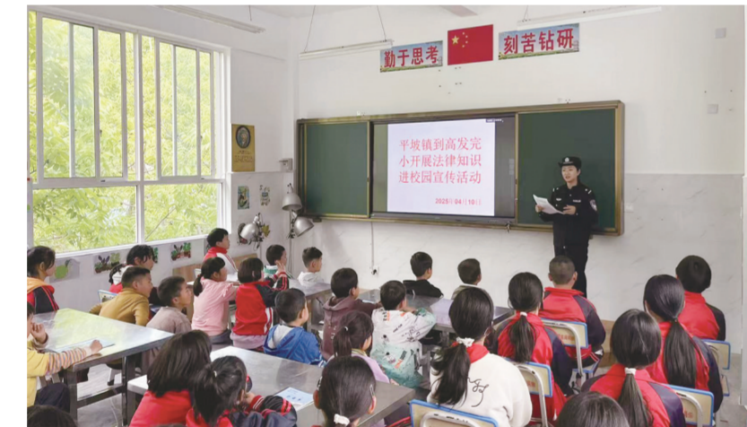
漾濞县平坝镇开展普法进校园活动。