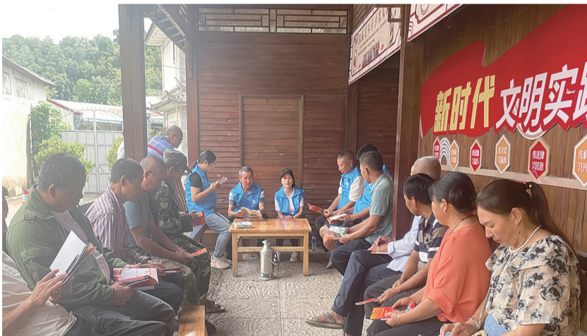
漾濞县“法律明白人”开展法治宣传。

法治长廊、法治广场等阵地,依托社区党群服务中心、新时代文明实践站等场所,设立法治图书角、法治宣传栏。目前,共建成1个乡镇、3个乡镇级、2个村级法治文化阵地,66个村(社区)设置法治图书角、法治宣传栏。 创建民主法治示范村(社区)。发挥民主法治示范村(社区)主阵地作用,通过以点带面,不断推动基层民主法治建设进程。苍山洱海基层治理获评“全国民主法治示范村”。截至目前,全县共创建7个省级民主法治示范村(社区),56个州级民主法治示范村(社区)。 强化综治中心阵地作用。漾濞县公共法律服务中心、9个乡镇司法所与县、乡两级综治中心实行阵地共建,力量整合、业务协同,全面做好群众接待、法律咨询、普法宣传、矛盾纠纷化解等工作,综治中心已成为最佳普法阵地。 多管齐下 优化法治建设维度 推行“普法+调解”工作模式。将人民调解与法律宣传有机结合,分析纠纷产生的法律根源,引导群众通过合法途径解决问题,实现“调解一案、普法一片”的效果。 建立“普法+法律服务”联动机制。整合基层司法所、律师事务所、法律服务所等资源,为群众提供“一站式”法律服务,在开展法治宣传时,同步提供法律咨询、法律援助申请、公证办理指引等服务。 推动“普法+基层治理”深度融合。在村(居)务公开、民主选举、重大事项决策等基层民主建设过程中,加强法治宣传,让群众了解相关的权利和义务,依法有序参与基层事务管理,推动基层治理法治化、规范化。