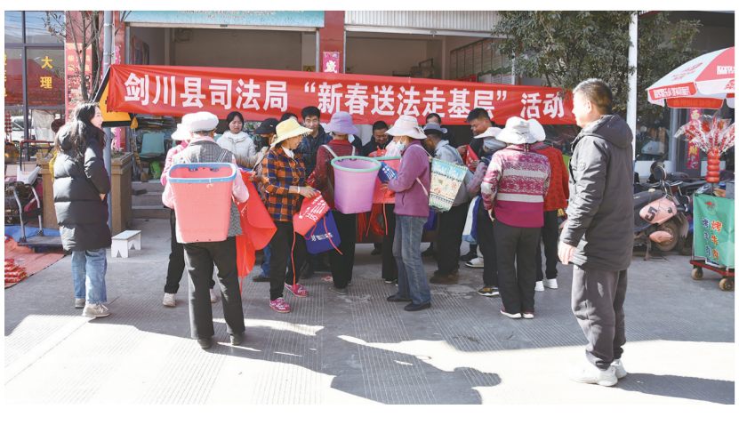
剑川县开展“新春送法进基层”活动。

等具有法律专业知识的人员担任村(社区)法律顾问,制定印发《剑川县村(社区)法律顾问工作职责清单》,建立法律顾问服务考核机制,切实推动村(社区)法律顾问工作从有形覆盖向有效覆盖转变。 建立结对帮带工作机制。共培养“法律明白人”568名,建立“法律明白人”工作室23间,挂牌“法律明白人”工作室13个,完成93名政法干警与村(社区)法律顾问结对帮带,村(社区)法律顾问的专业优势和“法律明白人”的乡土优势有机结合,全力打造一支政治素质高、结构优、用得上”的法律明白人队伍。 加强法律援助队伍建设。突出政治引领,实现党的工作和党的建设在法律援助行业全覆盖,组织党员律师深入基层开展普法宣传、法律援助解答、矛盾纠纷排查化解等法律服务,充分发挥党员律师先锋模范作用。严格落实监督管理职能,加大对律师办理重大法律事务和代理敏感案件的监督指导,每季度定期召开律师服务工作会议,分析研判并推进律师服务管理工作。 规范服务效能 擦亮惠民“金招牌” 减证便民,便捷增效。简化法律援助申请手续,实施“一次性告知”制度,法律援助向“减证便民”向“便民利民”提升。截至2025年6月,共受理法律援助案件164件,调解成功521件,调处成功率达96.88%;刑事法律援助72件;办理公证服务事项33件,解答法律咨询300余人次。 强化调解,共绘“枫”景。加强人民调解与行政调解、司法调解的衔接配合,成立了剑川县10个委派调解服务中心及行业纠纷、教育体育、生态环保等11个行业领域的专业性人民调解组织。打造了金华镇桑岭村、文榜村、甸南镇柳村规范化人民调解室,成功创建州级“枫桥式”司法所2个,省级规范化司法所1个。全县各级人民调解组织积极谋划创新,立足村情实际,与“枫桥经验”相结合,探索出甸南镇桑岭村“164”工作法人民调解新模式,实现基层矛盾纠纷精准化解,推进人民调解工作创新发展。2025年以来,各级调解组织受理和受理案件538件,调解成功521件,调处成功率达96.88%;刑事法律援助72件;办理公证服务事项33件,解答法律咨询300余人次。