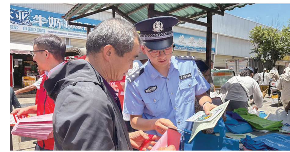
祥云县开展2025年防范非法集资活动宣传月活动。