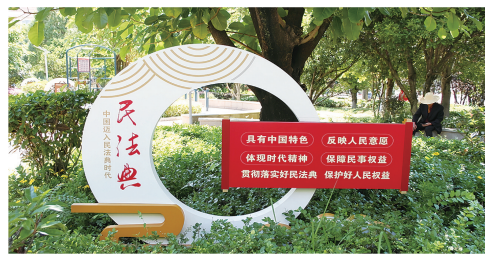
祥云县法治文化广场。