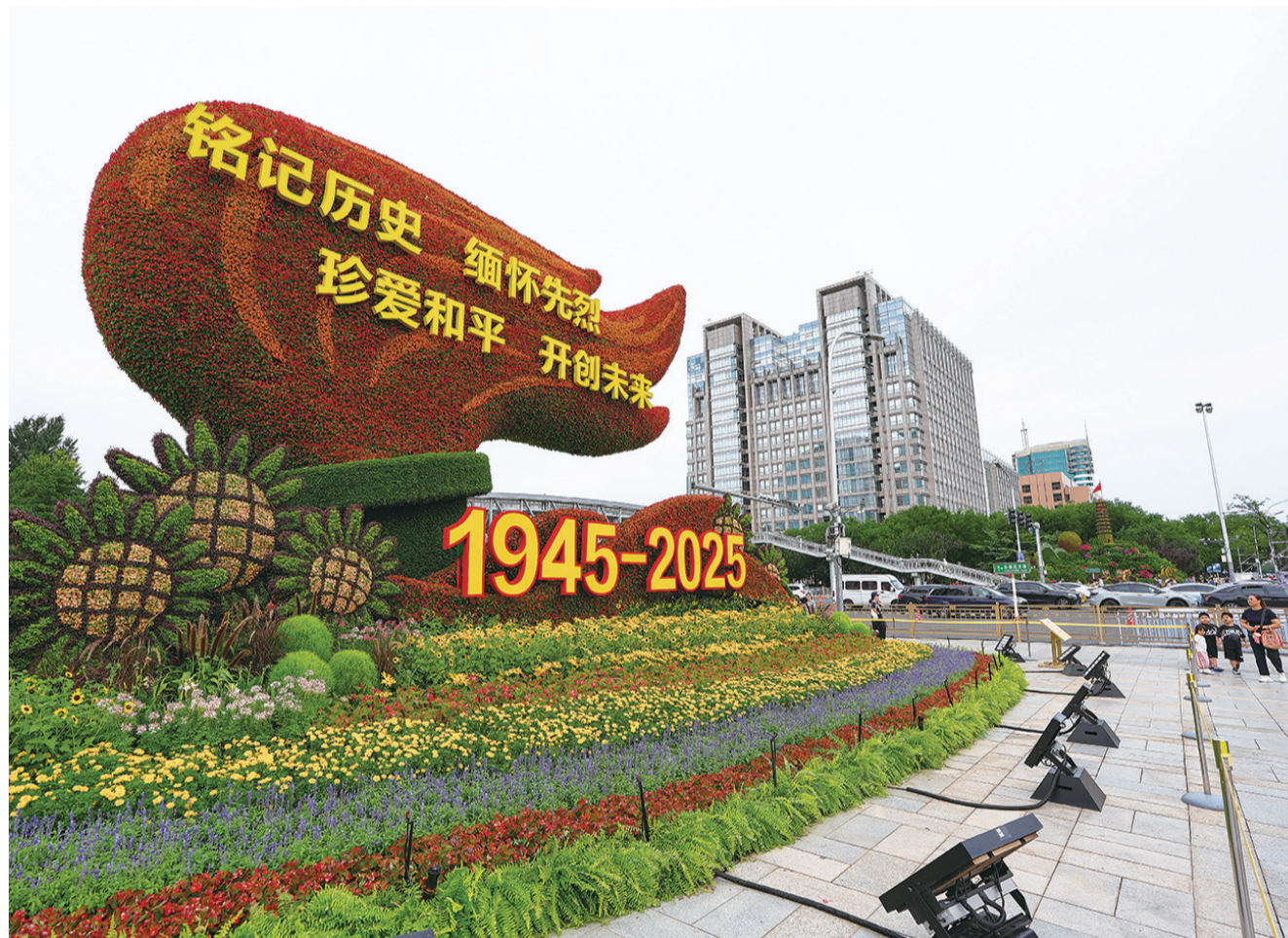
8月26日，人们在北京东单参观“薪火相传”花坛。