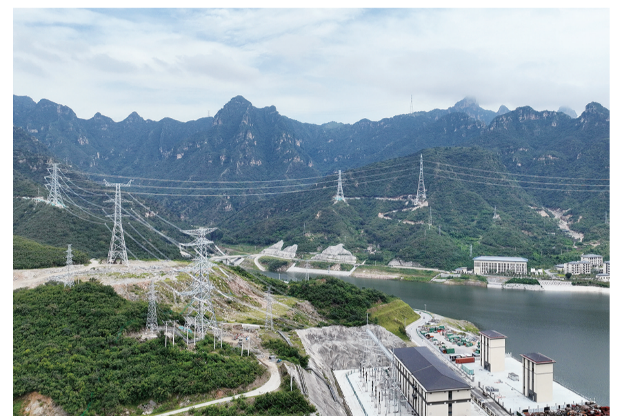
这是8月26日拍摄的河北省易县抽水蓄能电站下水库附近的电站送出线路(无人机照片)。当日，河北省重点项目——设计装机容量120万千瓦的易县抽水蓄能电站配套工程500千伏特高压送出线路并网投运。据国网河北省电力有限公司介绍，该能源送出线路全长49.937公里，将为易县抽水蓄能电站竣工投运后发挥调峰、填谷、调频、调相等作用提供支撑，助力太行山地区的新能源消纳和保障电网安全稳定运行。

记认定慈善组织1.6万家；全国备案慈善信托2531单，信托合同规模97亿元。民政部指定了29家互联网公开募捐服务平台和3家个人求助网络服务平台，600万人次通过这些平台奉献爱心超过1500亿元。自2021年以来，慈善力量向重点受灾省份捐赠救灾款物超过170亿元。