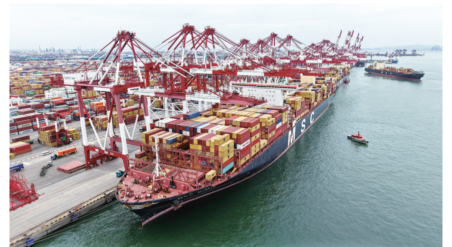
8月26日，货轮在山东港口青岛港前湾港区装卸集装箱(无人机照片)。近年来，山东港口青岛港依托青岛区位优势以及青岛上合示范区集聚辐射效应，积极服务和保障上合组织国家海上经贸往来。其中，“中亚航线”“印巴航线”以及“日韩-青岛-中亚”海铁联运过境箱量同比均涨幅明显。截至目前，青岛港共挂靠上合组织国家航线42条，通达上合组织国家的30多个港口，实现了货物吞吐量、新航线开辟“双增长”。