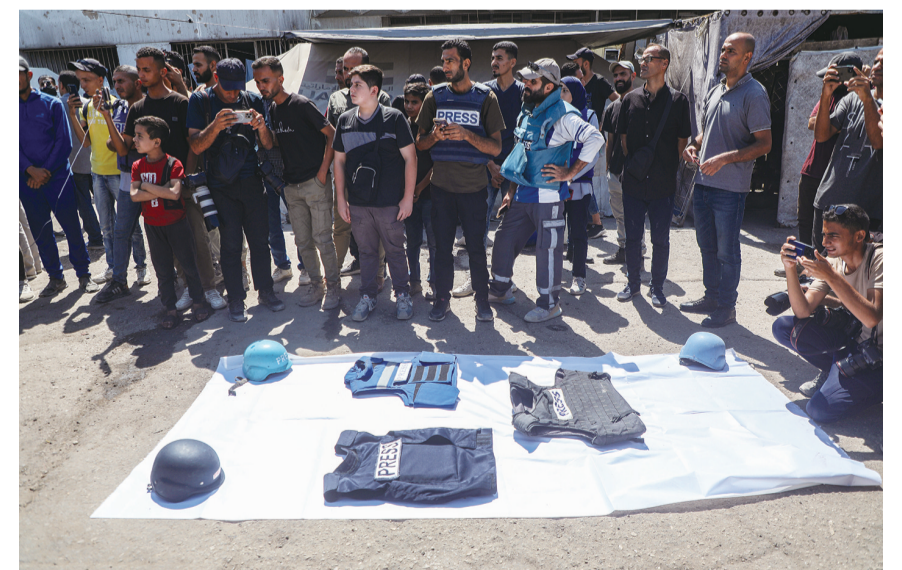
8月26日，巴勒斯坦记者和民众在加沙城参加集会，抗议以色列军队空袭加沙医院致5名记者遇难。8月25日，以色列军队两次袭击了位于加沙地带南部汗尤尼斯的纳赛尔医院，造成包括5名记者在内的至少20人死亡。