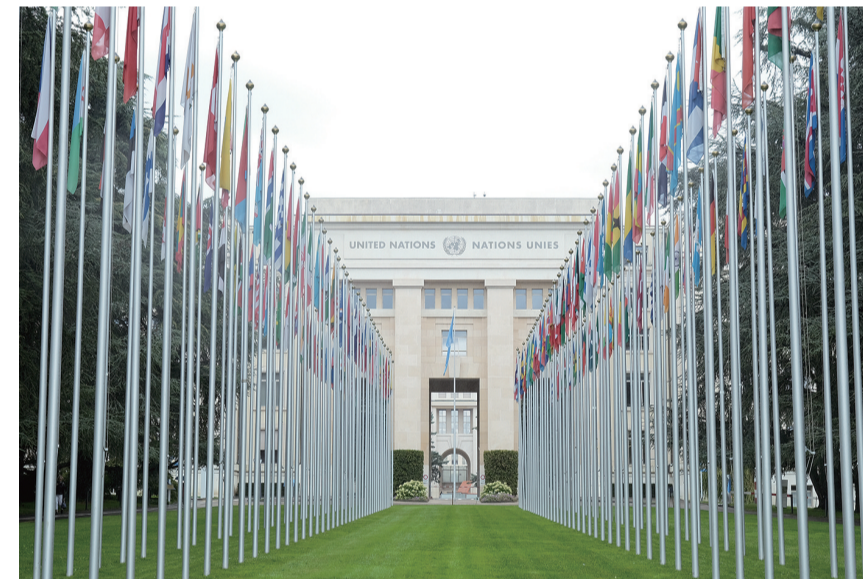
这是9月8日在瑞士日内瓦拍摄的万国宫。联合国人权理事会第60届会议8日在瑞士日内瓦万国宫举行“北京+30”高级别纪念活动，百余国常驻代表或高级外交官出席纪念活动。