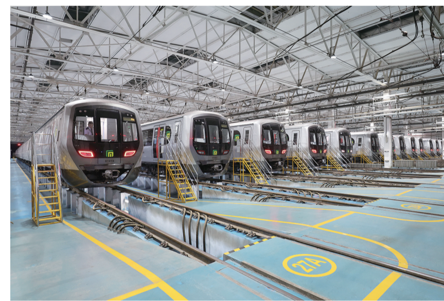
9月9日，地铁列车在石家庄市地铁西兆通车辆段整装待发。石家庄市轨道交通二期工程建设正在加快推进，4、5、6号线一期工程以及1号线三期工程均处于施工高峰期，预计于2027年建成通车。石家庄市地铁自2017年6月26日开通运营，标志着河北省正式迈入了“地铁时代”。当前，石家庄地铁建成投用里程78.2公里，建成车站60座，初步形成市区轨道交通网络骨架。截至2025年上半年，石家庄地铁共开行列车200.83万列次，累计安全运送乘客9.42亿人次。地铁出行已成为市民重要出行方式。