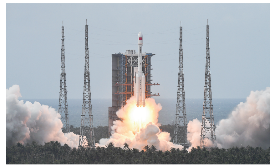
9月9日10时00分，我国在文昌航天发射场使用长征七号改运载火箭，成功将遥感四十五号卫星发射升空，卫星顺利进入预定轨道，发射任务获得圆满成功。