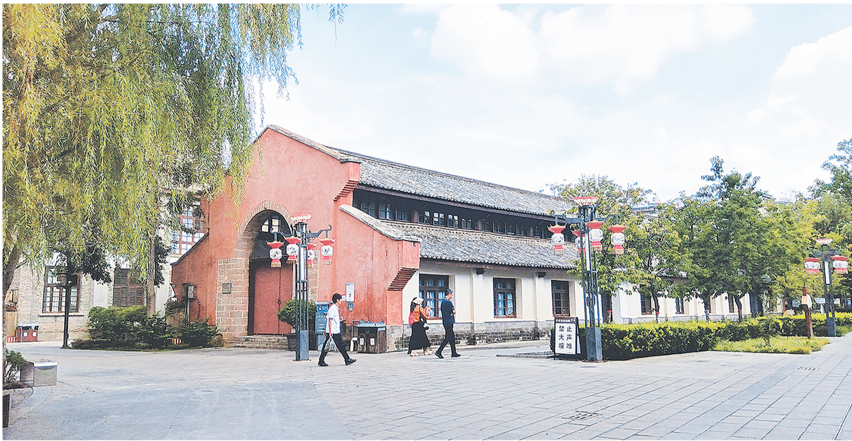
位于建宁公园活化利用后的原弥渡农机修配厂。(摄于9月10日)