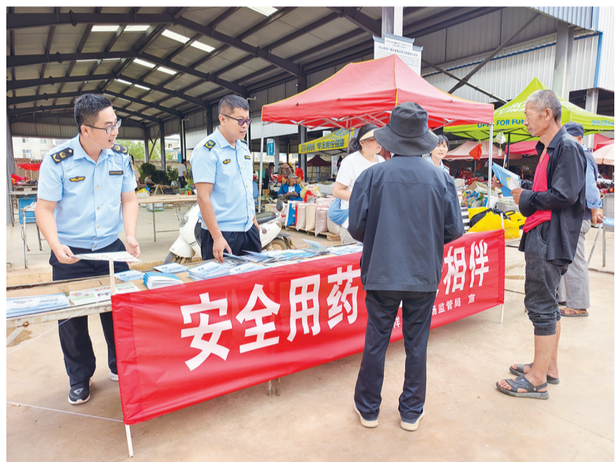
工作人员在祥云县一农贸市场开展安全用药知识宣传。(摄于9月5日)

连日来,祥云县市场监管局联合县检验检测所深入全县农贸市场、药品销售店、社区等场所开展“药品安全宣传周”活动。通过设立咨询台、发放科普宣传资料、现场解答等多种形式,向群众普及药品、医疗器械、化妆品安全知识和相关法律法规,全面提升群众用药安全意识,营造全社会关注用药安全的良好氛围。