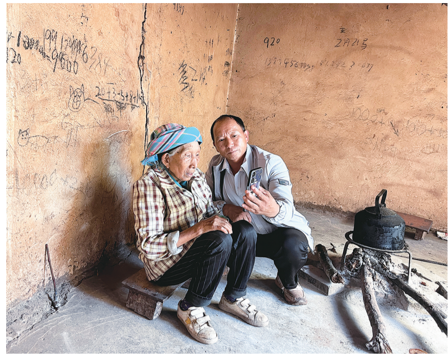
漾濞县漾江镇湾坡村志愿者在协助老人进行养老保险待遇领取资格认证。(摄于9月7日)

结合国家第三批公共文化服务体系示范项目——大理州弥渡县“大喇叭、小广场”配套建设工程,加强文物古建筑活化利用,积极构建群众精神文化家园,建设最美公共文化服务空间。活化利用图书馆1个、非遗传习展示中心1个、花灯传习馆1个、国学传承馆1个、书院1个、非遗传习所20个、农家书屋示范点4个等公共文化空间。