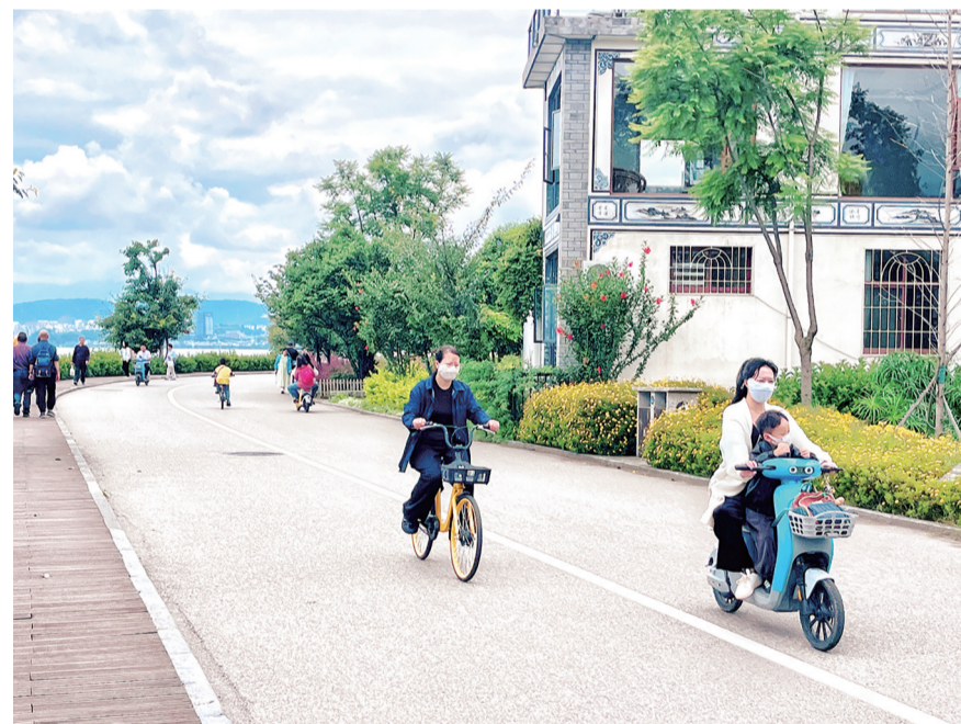
洱海生态廊道内,游客们有的在体验亲子骑行乐趣,有的在漫步赏景或驻足打卡,在绿树繁花与白族民居的映衬下,尽情享受生态之美。(摄于9月7日)

织密“五张网”,构建治理新格局。通过织密公共安全“防护网”、矛盾纠纷“化解网”、社会治安“防控网”、社会治理“智慧网”和网络安全“防范网”,宾川县实现治理资源整合、科技赋能、全域覆盖。全面实施“见警察、见警车、见警灯,安民心”的“三见一安”工程,深入推进“宾川快警”建设,落实“1分钟、3分钟、5分钟”分钟快速反应机制。投资1700万元建成视频图像大数据智能应用系统,推进“雪亮工程”和“智慧安防”小区建设,实现“技防+人防”精准管控。县、乡镇两级成立矛盾纠纷大调解工作联席会议及大调解中心,全县共设立调委会102个、行业专业性调解室1个、行业专业性法庭1个、个人调解工作室3个,共有人民调解员1861人,实现人民调解组织全覆盖。