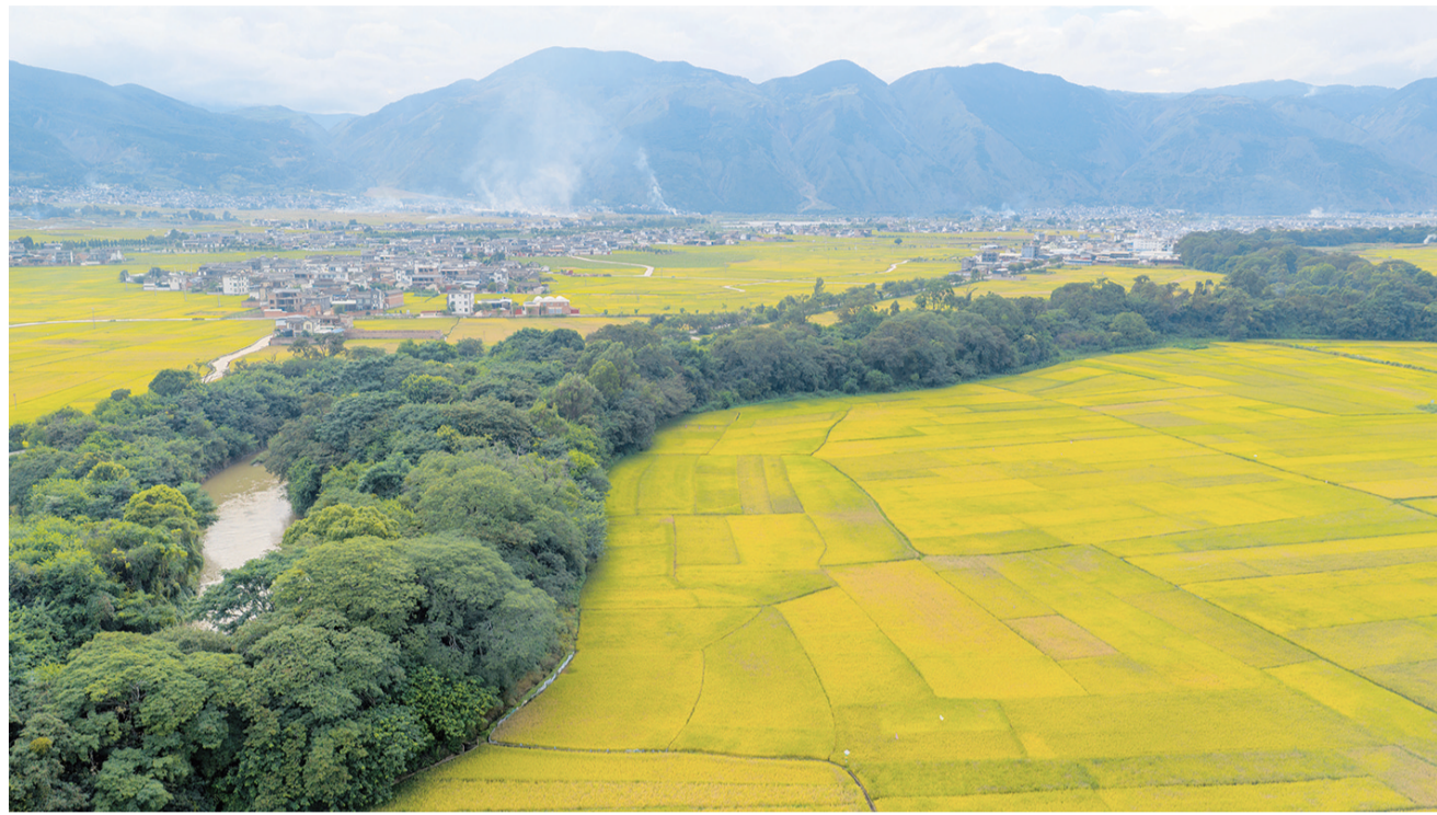
弥苴河畔绿野秋华。

在秋风秋雨的催促下，弥苴河古树群高空的枝叶都由翠绿渐变成墨绿、淡黄、深红了，有的如美丽蝴蝶一样，纷纷从树上飘落于树根而层层叠叠，挤挤挨挨，好像准备打算来年化作滋养