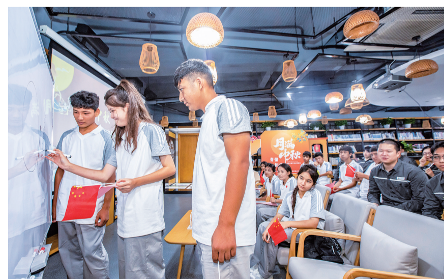
9月29日，“月圆公益”志愿服务队的青年志愿者与新疆班的学生们一起进行“你画我猜”的互动游戏。