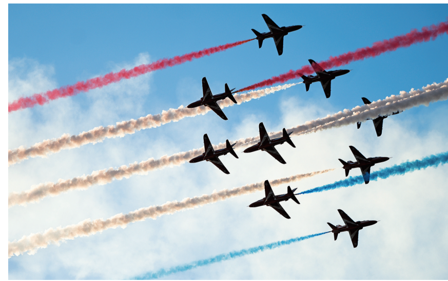
这是9月28日在马耳他圣保罗湾城拍摄的飞行表演。9月27日至28日，为期两天的马耳他国际航展在北部圣保罗湾城举行。