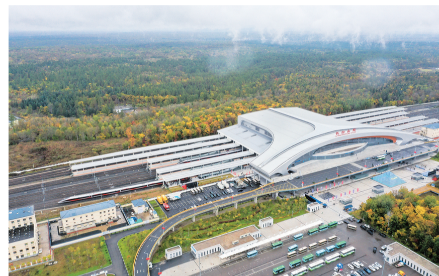
9月28日，从长白山站开往沈阳北站的G8166次列车驶出长白山站（无人拍照）。9月28日，沈阳至佳木斯高速铁路沈阳至白河段（沈佳高铁沈白段）正式开通运营。

《永久基本农田保护红线管理办法》10月1日起施行。办法对于永久基本农田划定、管控、保护、优化调整、质量建设等作出具体规定，在依法实行严格保护同时，将建立“优进劣出”管理机制作为重点，在永久基本农田保护红线整体稳定的前提下，明确了允许优化调整的情形、程序和规则，以兼顾耕地保护的刚性和农业生产的灵活性。