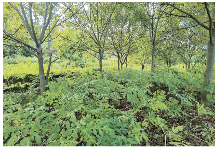
洱源县炼铁乡种植户在核桃林间套种的魔芋。(摄于9月21日)

近年来，洱源县充分利用核桃、板栗、木瓜和梅子等果树林下的闲置土地资源，以错时套种等方式，积极发展芋头、豌豆尖、青蚕豆、魔芋、重楼等种植产业，让土地效益最大化，促进农户增收。