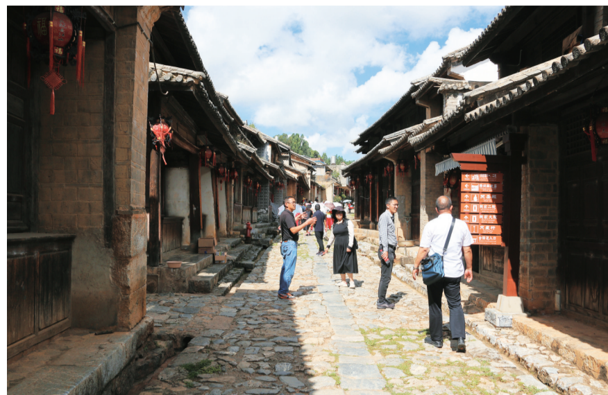
游客在祥云县云南驿茶马古道游玩。(摄于10月8日)

“下一步，我们将持续把物业服务管理监督作为民生监督的重要着力点，通过‘常态化检查+回头看’压实职能部门责任，跟踪问效整改落实情况，及时回应群众新诉求、新期盼，用精准有力的监督，让‘小物业’真正服务好‘大民生’，持续激活基层治理活力。”县纪委监委有关负责人表示。