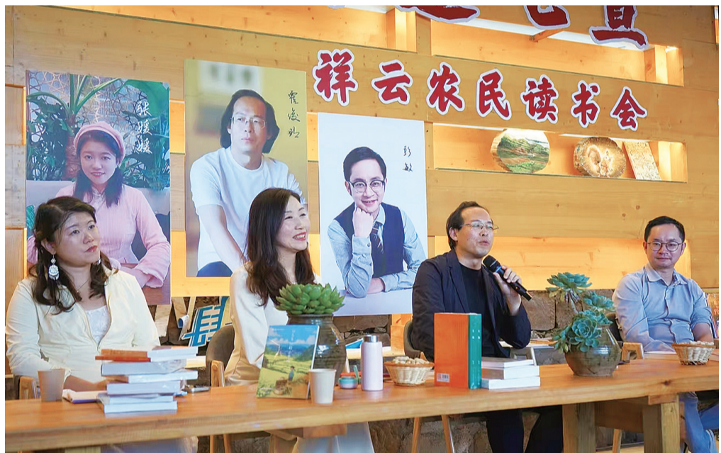
8月30日，祥云县举办“浪漫七夕 诗遇七宣”祥云农民读书会。

祥云农民作家以乡土文化能人的身份，深入推进乡村文化建设和发展，赋能乡村振兴建设。祥云农民读书会，不仅是满足农民精神文化需求的平台，也是农村农民精神共富的传递者。未来，农民读书会这股清新的阅读之风，将拂遍乡村的每一个角落，为乡村振兴注入强大的精神源泉。