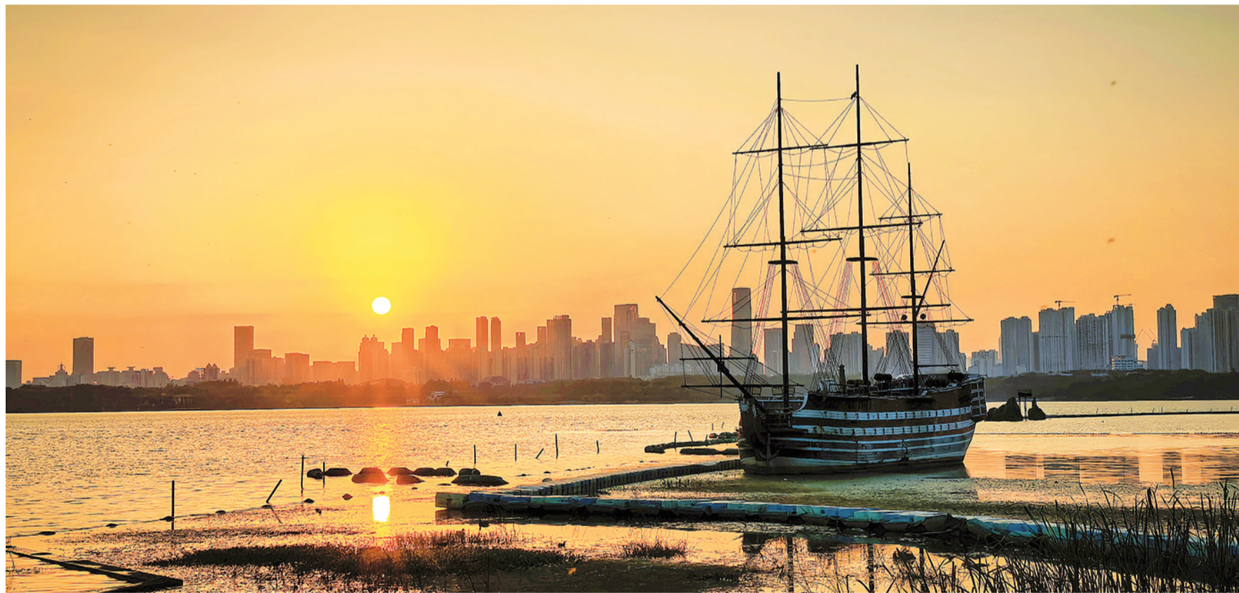
10月22日，湖北省武汉市的东湖风景区在夕阳和晚霞的映衬下，壮美如画。

李斌表示，总的来看，今年以来，面对复杂严峻的外部环境，我国外汇市场顶住压力稳健运行，市场预期平稳，外汇供求基本平衡，展现出较强的韧性和活力。