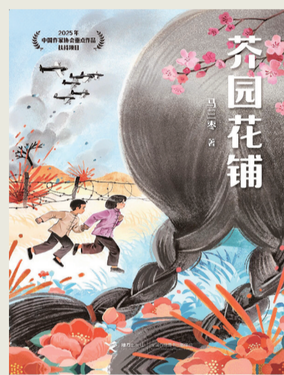
《芥园花铺》 马三枣 著 接力出版社2025年8月第一版

本书关注着大众在战争中遭遇的苦难。人文观照和人性发掘成为作品主旨。作品首次关注了日本军国主义者对自己同胞的戕害，战败后，日本军国政府遗弃甚至杀害了包括儿童在内的大量日本“移民”，而善良的中国百姓收养了这些孩子。这部作品既是历史维度的童年书写，也是以童年视角构建的历史，勾勒了历史劫难中的童年命运。以“花铺”为叙事背景，正是以鲜花之美好反衬战争的残酷，也象征着童年精神对“善”“美”毫无保留的信任和坚守。