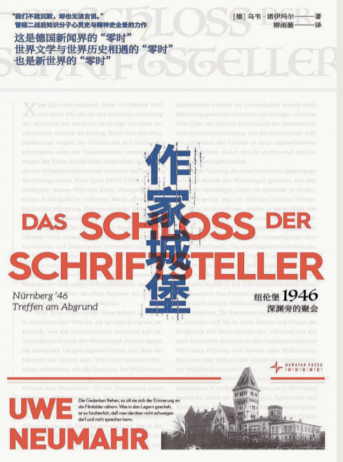
《作家城堡：纽伦堡1946，深淵旁的聚會》 [德]乌韦·诺伊马尔 著 柳雨薇 译 新星出版社2025年9月第一版

本书关注着大众在战争中遭遇的苦难。人文观照和人性发掘成为作品主旨。作品首次关注了日本军国主义者对自己同胞的戕害，战败后，日本军国政府遗弃甚至杀害了包括儿童在内的大量日本“移民”，而善良的中国百姓收养了这些孩子。这部作品既是历史维度的童年书写，也是以童年视角构建的历史，勾勒了历史劫难中的童年命运。以“花铺”为叙事背景，正是以鲜花之美好反衬战争的残酷，也象征着童年精神对“善”“美”毫无保留的信任和坚守。