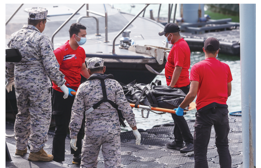
11月10日，马来西亚吉打州，搜救人员转移遇难人员遗体。马来西亚海事执法部门11日表示，截至目前，在马来西亚与泰国之间海域的偷渡船沉没事件中马方共发现12具遇难者遗体，搜救行动仍在继续。

马来西亚警方9日发布的初步调查显示，疑似约300名非法偷渡者在缅甸登船前往马来西亚。为躲避执法部门的巡查与拦截，偷渡集团在靠近马来西亚海域后将人员分成小船转运，其中一艘日前在马泰之间海域沉没。