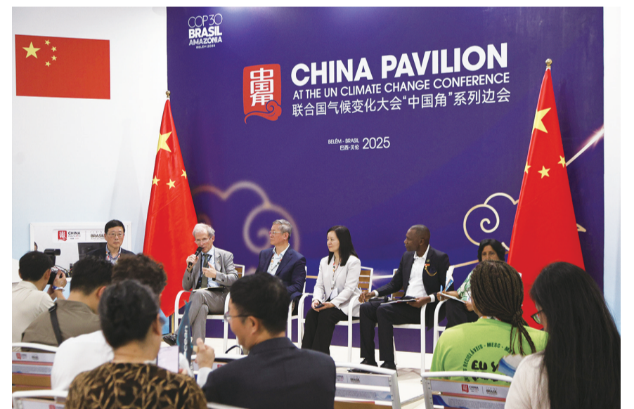
11月10日，在巴西贝伦，人们参加COP30“中国角”系列边会的首场边会。当地时间10日上午，《联合国气候变化框架公约》第三十次缔约方大会（COP30）“中国角”系列边会在巴西贝伦拉开帷幕，首场边会聚焦生态文明和美丽中国实践。

本次评选将经过提名、审核、展示、点赞、专家评审等环节，最终通过专家投票和网民点赞加权的方式，从60位（组）候选人中产生出“2025年中国网事十大感动人物”。