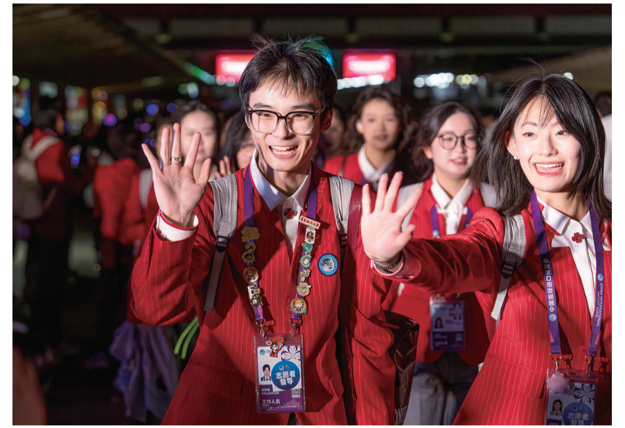
11月10日，在国家会展中心（上海）举行的第八届进博会志愿者离岗仪式上，“小叶子”们互相告别。

夜幕下，国家会展中心（上海）东登录厅长廊步道充满欢声笑语。第八届进博会闭幕之际，“小叶子”（进博会志愿者昵称）们圆满完成志愿服务工作，正式离岗。