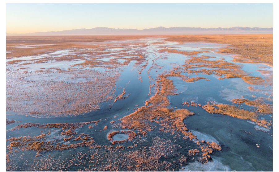
这是11月14日在甘肃省酒泉市阿克塞县阿伊纳乡拍摄的小苏干湖风光(无人机照片)。入冬以来,位于甘肃省酒泉市阿克塞哈萨克族自治县境内的“姊妹湖”——大、小苏干湖陆续封冻。澄澈的湖面在阳光下熠熠生辉,犹如镶嵌在西北高原上的璀璨明珠。大、小苏干湖由祁连山冰雪融水汇聚而成,虽一水相连,却呈现“上游小苏干湖为淡水湖、下游大苏干湖为咸水湖”的独特现象。它们共同在广袤戈壁中滋养出一片生机盎然的生态湿地,成为我国候鸟迁徙路线上重要的中转站和繁殖栖息地之一。作为甘肃省最大的内陆湖泊系统,大、小苏干湖于1982年被划定为省级候鸟自然保护区。