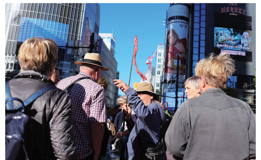
11月17日,游客在日本东京的涩谷站附近游览。由于投资者担心中日关系恶化导致访日游客减少,日本东京股市百货公司、运输、消费等旅游相关股票17日遭投资者抛售,部分股票大跌超过10%。