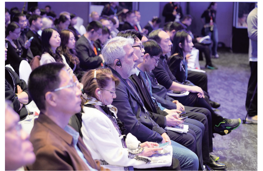
这是11月16日拍摄的2025超大城市治理智库交流会(北京)现场。11月16日,以“城市正智慧 生活更美好”为主题的2025超大城市治理智库交流会(北京)举行,来自多个国家和地区的200多名专家学者和城市治理者,共同探讨超大城市治理的新路径。