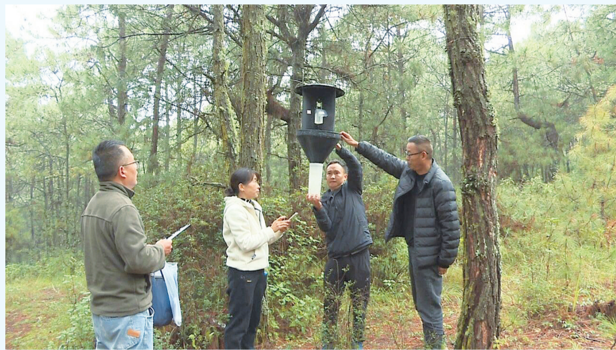
工作人员查看诱捕器诱捕害虫的情况。(摄于11月6日)

在森林有害生物治理方面,弥渡县积极推广绿色防控技术,特别是在核桃病虫害防治中,大力推广“以虫治虫、以菌治虫”等生物防治方法。唐绍荣介绍道:“叉角厉蝎是捕食性的