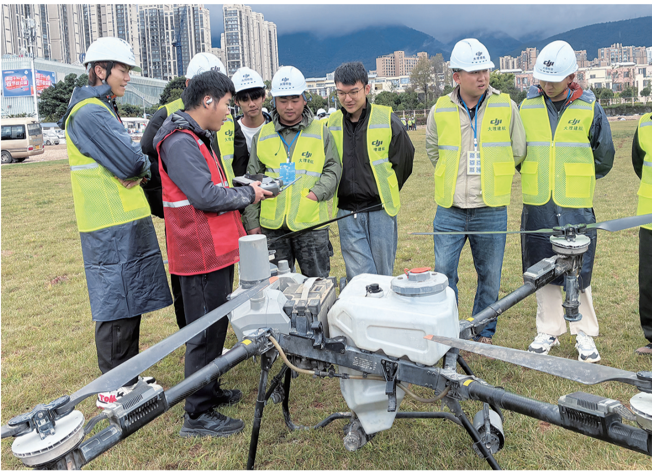
学员正在听老师讲解农业无人机操作要领。(摄于11月21日)

据介绍，近年来，云南省农业广播电视学校大理州分校以高素质农民培育为抓手，立足本地产业特色，不断培育出一批批农业“带头人”“领头雁”，推动“新农人”从“会种地”向“慧种地”转变。下一步，该校将持续以技能培育为纽带，推动更多科技兴农举措落地，让智慧农业扎根大理田野，以人才振兴助力乡村全面振兴，绘就数字化兴农、丰产增收新图景。