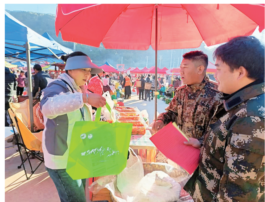
工作人员正在向群众宣传野外用火相关规定。(摄于12月5日)

下一步，永平县发改局、应急管理局将持续加大对乡镇储备点的检查指导力度，定期开展物资管理“回头看”，确保每一件救灾物资在关键时刻充分发挥作用，为全县经济社会发展和群众生命财产安全筑牢防灾减灾安全屏障。