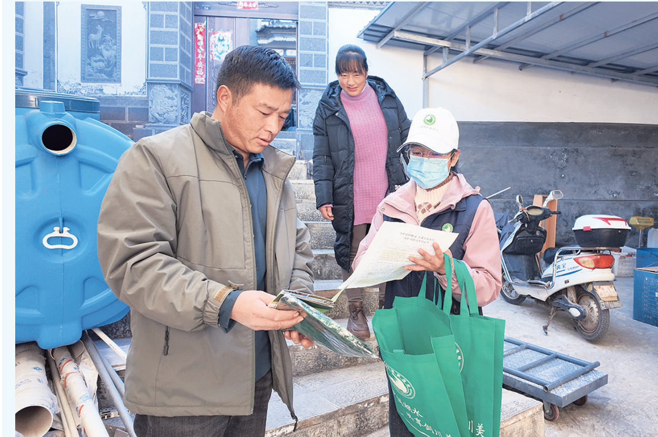
工作人员在向群众宣传湿地保护知识。(摄于12月4日)