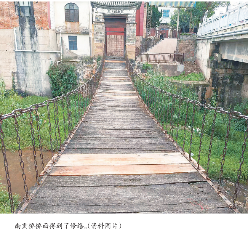
南熏桥桥面得到了修缮。(资料图片)