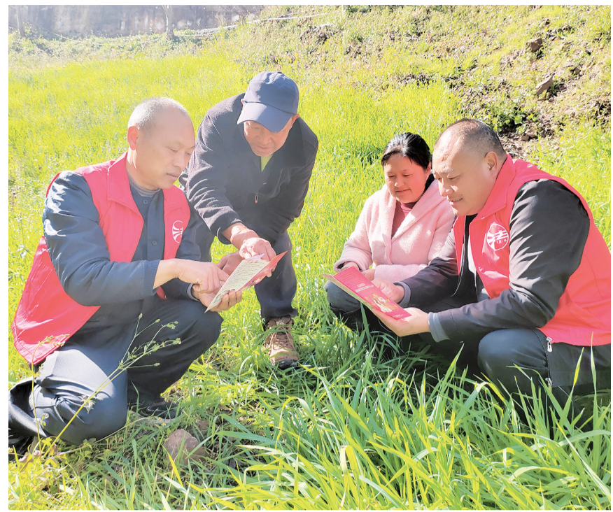
永平县司法局厂街司法所工作人员和厂街乡老鹿坡村“法律明白人”在进行普法宣传。(摄于12月9日)

近期,永平县司法局厂街司法所组织工作人员和“法律明白人”深入田间地头,结合生产生活实际案例,向群众宣传法律法规知识。