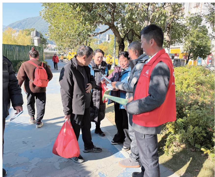
大理市太和街道兴国社区志愿者们向居民宣传森林草原防火知识。(摄于12月3日)

当天,为提升群众对森林草原防火工作的知晓率、支持率和参与度,兴国社区组织志愿者们开展森林草原防火宣传活动。