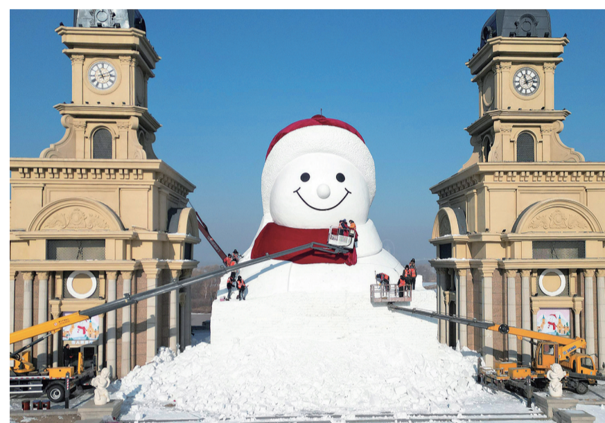
12月14日拍摄的建设中的哈尔滨市群力音乐公园网红大雪人(无人机照片)。

12月14日,正在建设的哈尔滨市群力音乐公园网红大雪人头部已完成,露出憨态可掬的笑容。