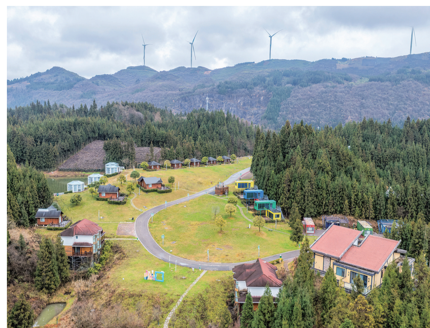
这是12月13日拍摄的石柱县冷水镇“冷水风谷休闲度假营地”景色(无人机照片)。

重庆石柱县冷水镇地处渝鄂交界的武陵山区,平均海拔约1400米,森林覆盖率85%,生态资源丰富。