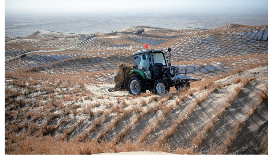
12月13日,施工人员在库姆塔格沙漠驾车运送铺设沙障的物资。

一场大雪过后,在甘肃省酒泉市阿克塞哈萨克族自治县的库姆塔格沙漠边缘,施工人员忙着铺设沙障。