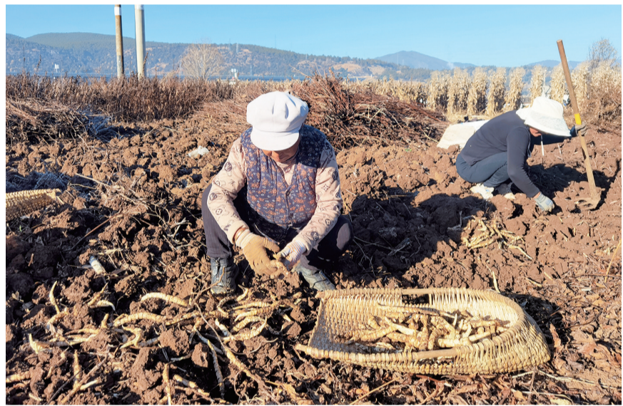
剑川县甸南镇印盒村种植户正在采挖地参。（摄于12月16日） 连日来，印盒村150多亩地参田进入采挖季，种植农户们严格遵循“种、挖、洗、煮、晒、卖”六道工序，确保干品品质。目前，地参干品每公斤售价在15元左右，亩均收入达1.4万元，地参已成为当地农户眼中的“生态金参”。