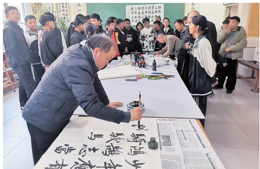
永平县退休老干部、老艺术家在水泄乡创作书画作品。（摄于12月16日） 当天，水泄乡新时代文明实践所开展了“翰墨润彝乡 丹青绘振兴”书画下乡活动，老艺术家们现场挥毫泼墨、赠书留香，随后走进校园，耐心传授执笔、运笔知识。活动以翰墨为媒，活化乡土文化资源，在青少年心中播撒传承火种，为乡村振兴筑牢精神根基、注入发展动能。