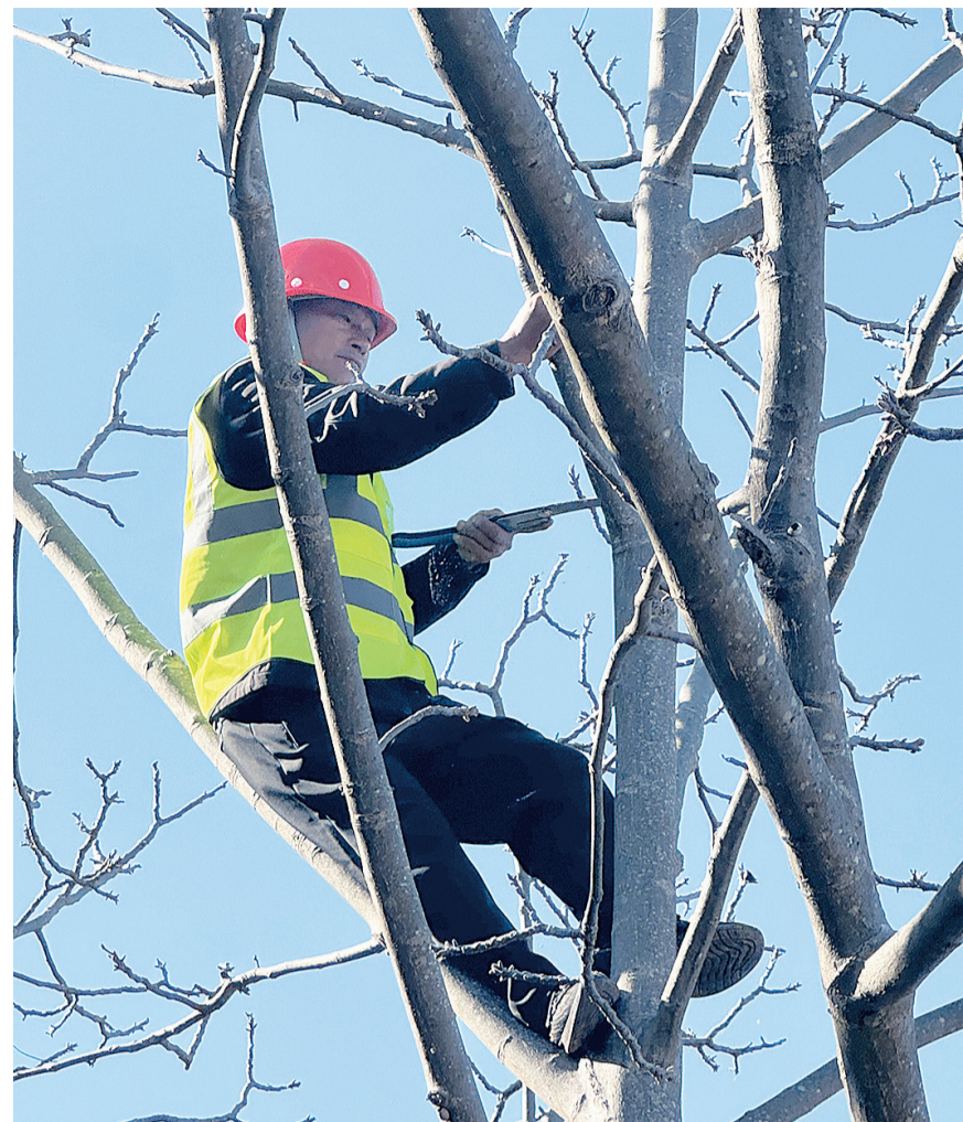
弥渡县核桃低效林改造项目在牛街乡开工。（摄于12月18日） 该项目通过技术培训引导农民转变种植理念，推动核桃产业从粗放经营向标准化、高效化转型。项目的实施能有效提升核桃的产量和品质，带动林农收入稳步增长。

五年来，祥云县系统推进健康祥云建设，开展三轮爱国卫生“7个专项行动”，国家卫生县、卫生乡镇通过省级评审。营造全民健康浓厚氛围，倡导文明健康绿色环保的生活方式，居民健康素养水平提升至25.62%。持续完善健康促进体系，建成省级卫生乡（镇）9个、卫生村118个；巩固国家级健康促进县、省级慢性病综合防控示范区及病媒生物防制先进城区建设成果；建成一批高标准的健康细胞。全县人均预期寿命提升至79.93岁，孕产妇死亡率、婴儿死亡率等主要健康指标水平持续向好，居民健康水平得到切实提升。