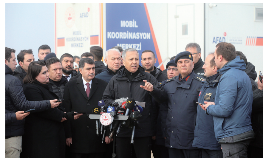
12月24日,土耳其内政部长阿里·耶尔利卡亚(中)在安卡拉省哈伊马纳区一座村庄附近的坠机现场接受媒体采访。利比亚军队总参谋长穆罕默德·阿里·艾哈迈德·哈达德23日结束对土耳其的正式访问后,于回国途中在土耳其境内坠机遇难。