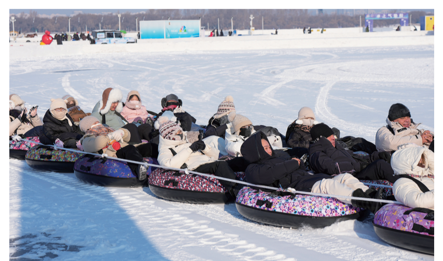
12月25日,人们在2026第八届哈尔滨松花江冰雪嘉年华园区内体验冰雪娱乐项目。12月25日,2026第八届哈尔滨松花江冰雪嘉年华开幕。本届冰雪嘉年华以145万平方米超大规模创历届之最。活动推出近60项特色项目,为市民与游客打造一场“冰天雪地·欢乐同行”的冬日狂欢。