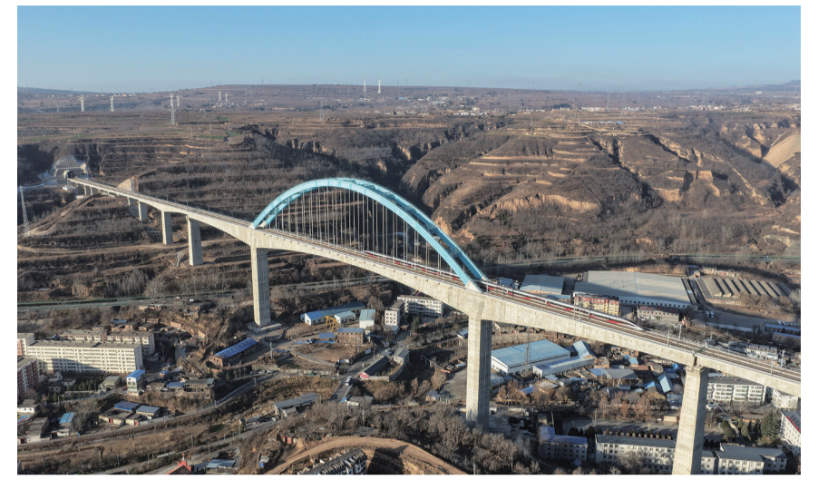
12月25日,试验列车驶过西延高铁王家河特大桥(无人机照片)。西安至延安高速铁路关键控制性工程王家河特大桥位于陕西省铜川市王益区,是西延高铁全线跨度最大、高度最高的桥梁。桥梁全长1066米,其主跨采用248米连续刚构拱组合结构,桥面距谷底高达105米,是国内高速铁路无砟轨道桥梁中同类结构的跨度与高度双项纪录保持者,对保障西延高铁全线贯通具有决定性意义。