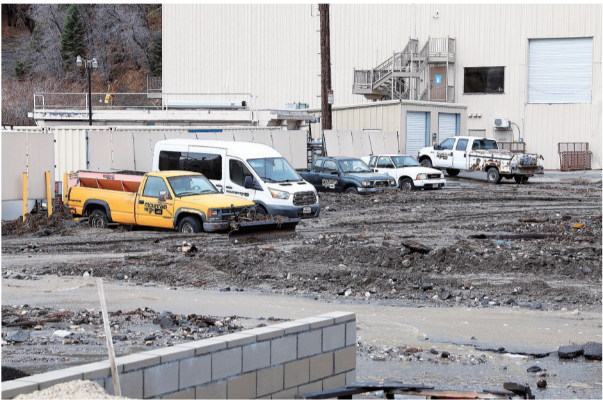
这是12月25日在美国加利福尼亚州圣贝纳迪诺县赖特伍德拍摄的一处受损的滑雪场。 美国加利福尼亚州广大地区圣诞节假日期间持续遭受“大气河”引发的强风暴袭击。截至25日上午，已至少有3人死亡，12万户居民处于停电状态。加州政府已宣布多地进入灾害紧急状态。