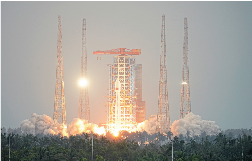
12月26日7时26分，我国在海南商业航天发射场使用长征八号甲运载火箭，成功将卫星互联网低轨17组卫星发射升空，卫星顺利进入预定轨道，发射任务获得圆满成功。