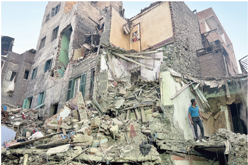
12月25日，救援人员在埃及吉萨省因巴拜区一处倒塌的房屋废墟工作。 据埃及媒体25日报道，埃及吉萨省一栋楼房23日发生倒塌，造成至少8人死亡、另有多人受伤。目前搜救工作仍在进行。初步信息显示，倒塌建筑属于老旧房屋。事故原因正在调查中。