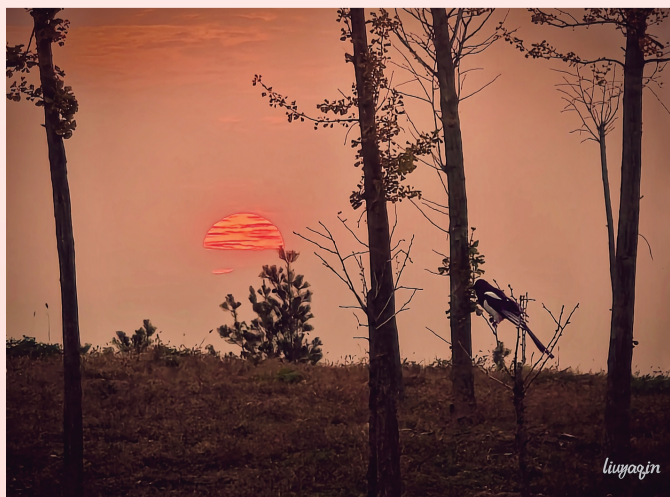
夕阳下的鸟