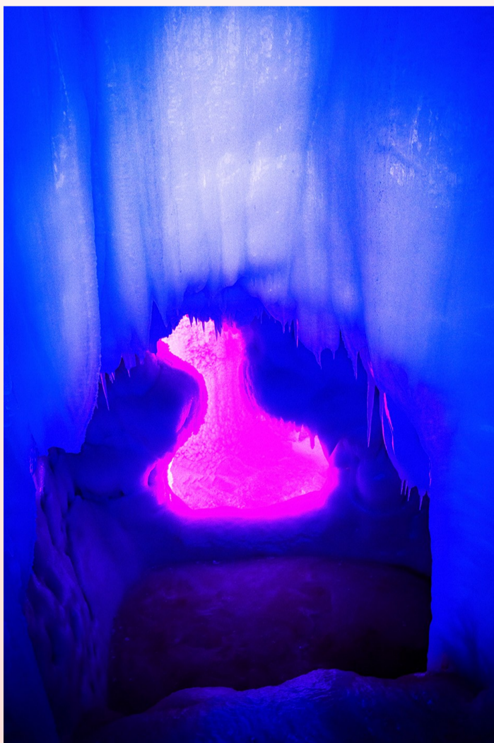
云丘山冰洞