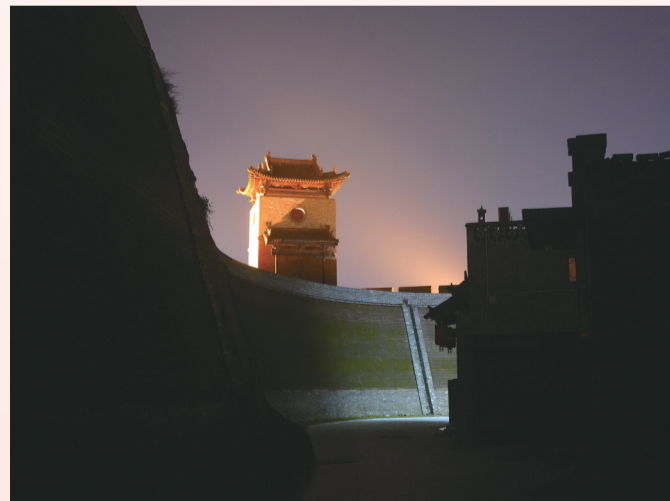
千年风华——平遥古城墙