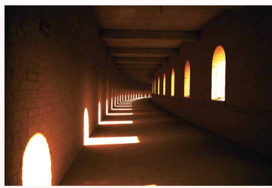
晋城湘峪古堡