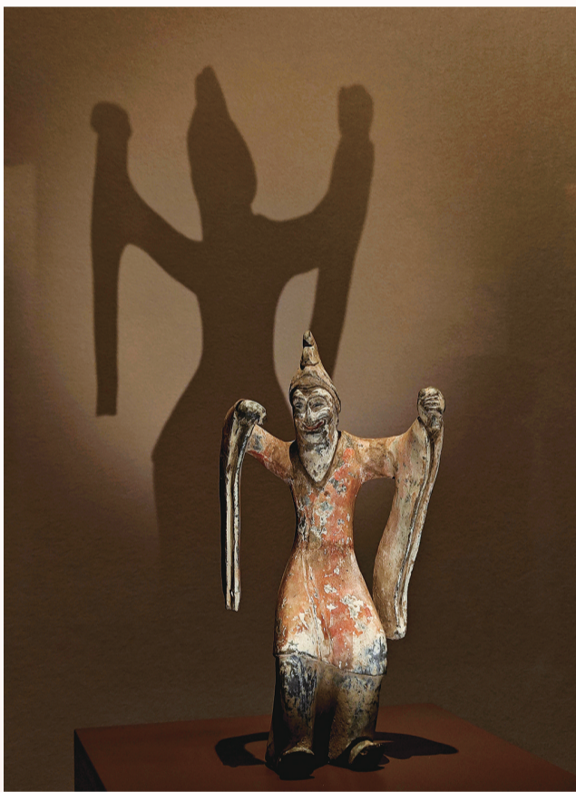
山西博物院舞俑