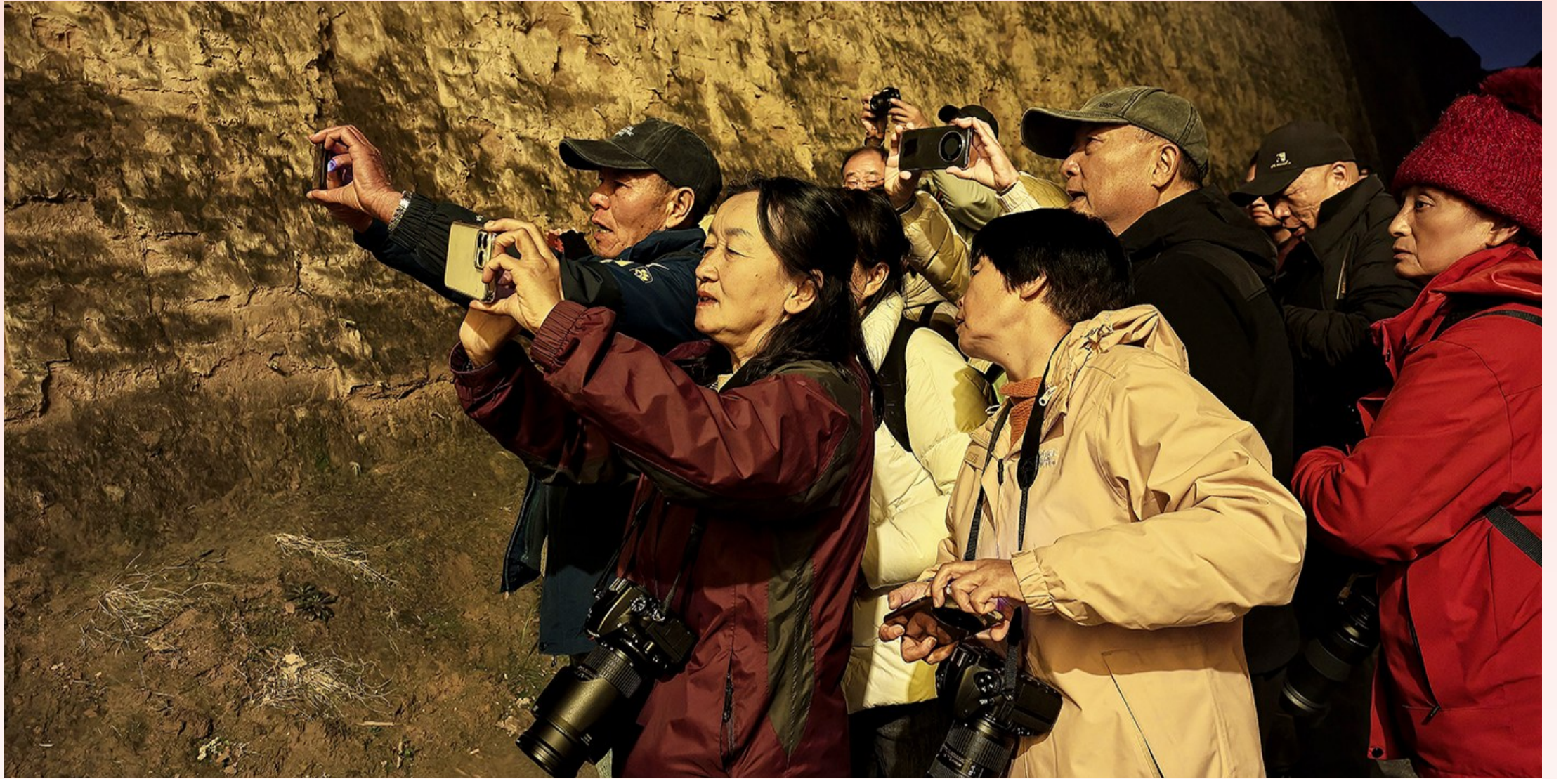
游学学员在山西游学期间进行夜间摄影创作。

大理老年大学摄影班多年来重视教学与实践相结合，把课堂上的理论与摄影技巧学习和实地摄影实践有效结合起来，深得学员们的认可和喜爱。摄影班一直是很多老年人比较喜欢的专业，摄影班的学员不仅能学到摄影基础知识，还能到大自然中进行摄影创作实践，这种动脑、动手，更要动脚的学习方式既改变了老年学员们的生活方式，又容易培养起他们积极、乐观、健康、快乐的生活态度。多次的出国、出省和本地的摄影创作实践活动很好地体现了学员们老有所学、老有所乐、老有所为的精神实质，又调动了摄影班学员的创作积极性，学员们在游学中快乐体验和创作，在摄影实践中提高了摄影水平，既丰富了他们的生活内容，又在游学中实现了自我价值。