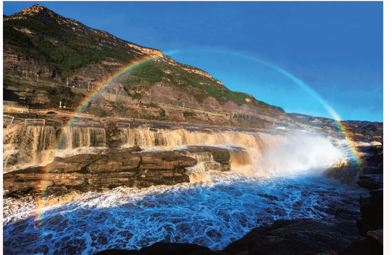
黄河跨彩虹