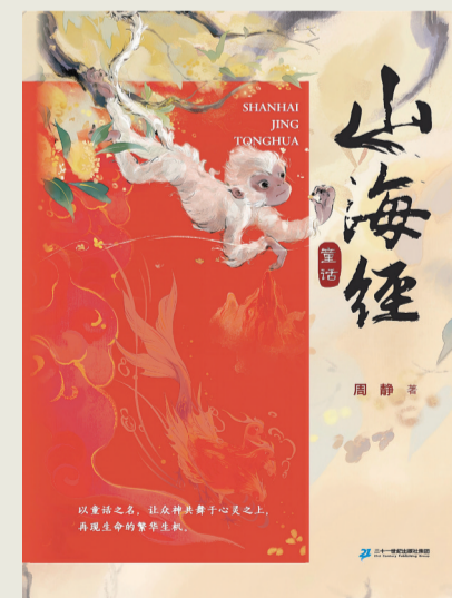
《山海经童话》 周静 著 二十一世纪出版社 2025年11月第一版

上古奇书《山海经》是一部神话人文地理书。童话作家周静著的《山海经童话》，可能是儿童文学中目前为止最贴近《山海经》原貌的一种重述方式。《山经》《海经》《大荒经》，该著一一以童话的方式予以重新讲述，以“重融于更为广阔、包含万千的世界中，重回那生命最初的一切皆新奇的状态”。于是，在浪漫瑰丽的想象中，该书带领小读者感受和领略永恒的生命本质和原初的生命性情。