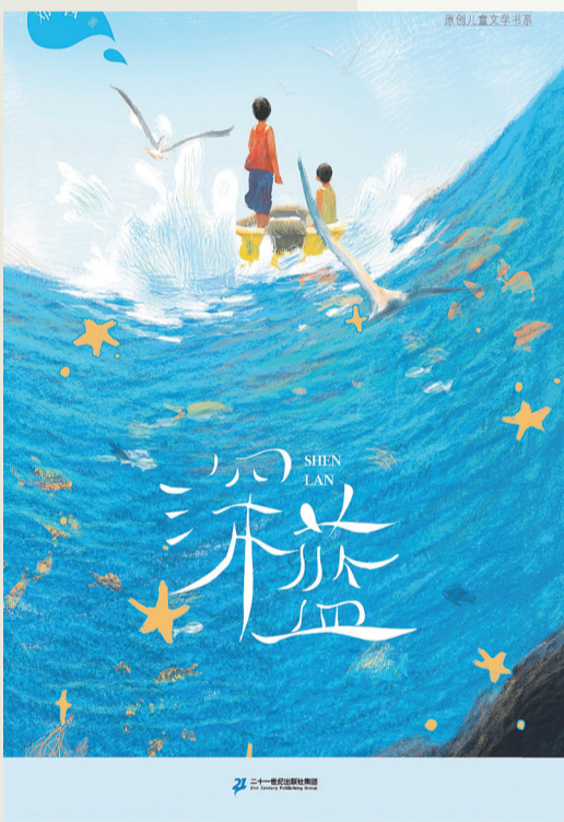
《深蓝》 邓西 著 二十一世纪出版社 2025年11月第一版

本书聚焦具体作品，从博物学、艺术史以及社会学、政治学等视角展开分析，揭示了清宫博物绘画的诸多秘密：“汉绘传承”部分探讨了清宫绘画对汉民族博物绘画技法和特色的继承；“满风融汇”部分讨论满洲文化与清宫博物绘画之间的关系；“寰宇交流”部分讲述清宫博物绘画背后的中外文化交流。无论论述、研究方法，还是具体论述，本书都给我们以耳目一新之感。