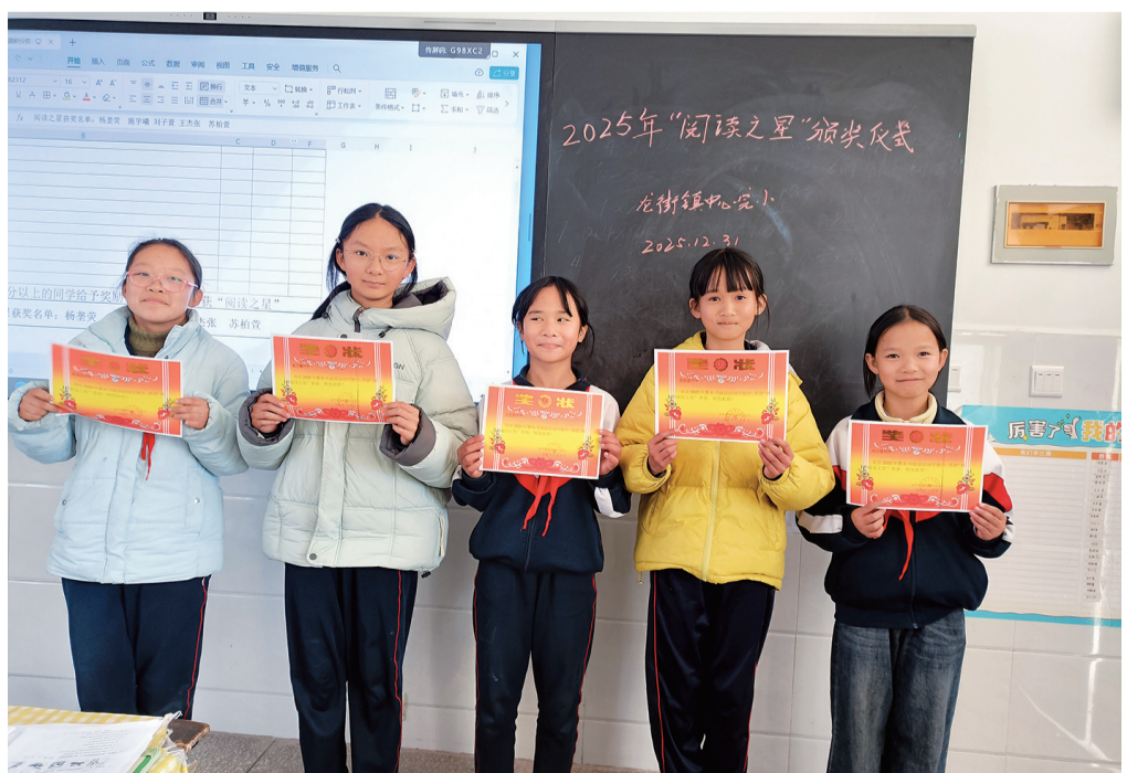
近日，永平县龙街镇中心完小开展整本书阅读“阅读之星”评选活动，对5名同学进行了表彰。该镇中心小学制定阅读计划和“阅读之星”评选方案。学年来对学生记录的阅读书目和字符进行统计、评选。在此次阅读评选活动，经过统计组对学生整本书阅读的本数和积分认真统计和评选，最终从阅读积分达2400分以上的同学中，评出了5名同学为“阅读之星”。

“腹有诗书气自华”。阅读，是一辈子应该坚持做的事情。愿大家喜欢阅读。因为，阅读的时光最美好。愿你在文字中遇见更美好的世界，遇见更好的自己。