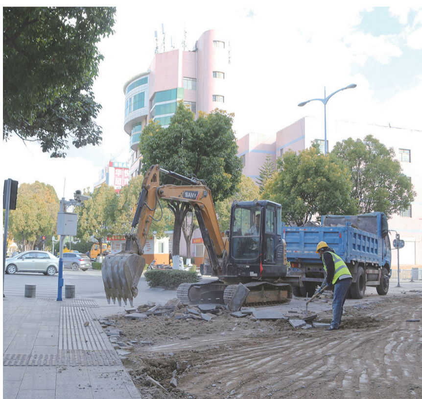
工人在祥云县祥城镇文化东路更换人行道破损地砖。(摄于1月7日) 近年来，祥云县在城市更新中，以“绣花功夫”推进老旧小区改造、基础设施完善和人居环境提升，进一步激发城市活力，让市民享受更多发展成果。 【通讯员 李思怡 摄】

医保基金使用的相关规定和需要注意的环节等内容，通过“下沉式指导”“理论+案例”“点对点教学”，深入讲解了基金使用规范及常见违规风险防范，进一步提升了该县医保系统及定点医疗机构相关人员对基金监管政策的理解力、执行力，强化法治意识与风险防控能力，对下一步规范医保基金使用、提升患者服务体验具有重要促进作用。