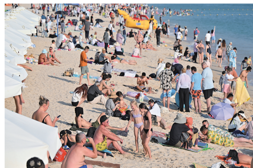
1月11日,游客在三亚大东海游玩。