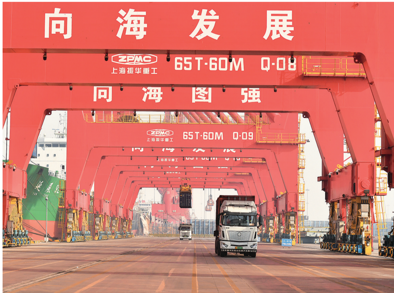
1月15日,在黄骅港综合港区集装箱码头,岸桥设备在进行卸船作业。

与此同时,管理办法对未按要求交售废旧动力电池、不履行回收责任、违反编码和信息报送要求等行为,设定了责令改正、警告、罚款等行政处罚措施,并明确了行政处罚的实施主体,增强制度刚性的约束。