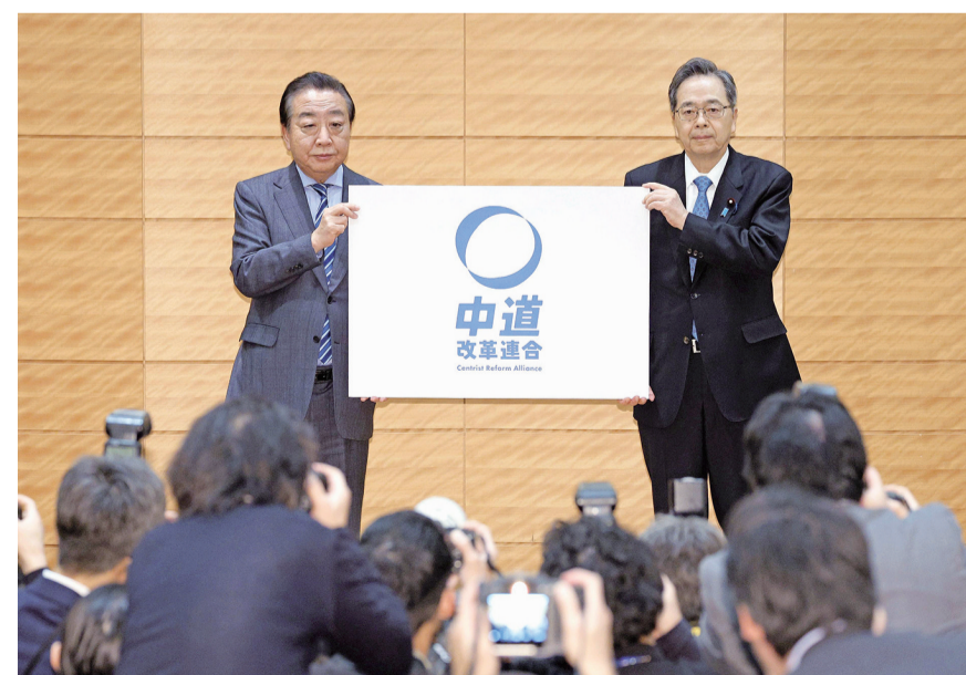
1月16日,在日本东京,立宪民主党党首野田佳彦(上左)与公明党党首齐藤铁夫(上右)在记者会上展示两党共同组建的新党名称。