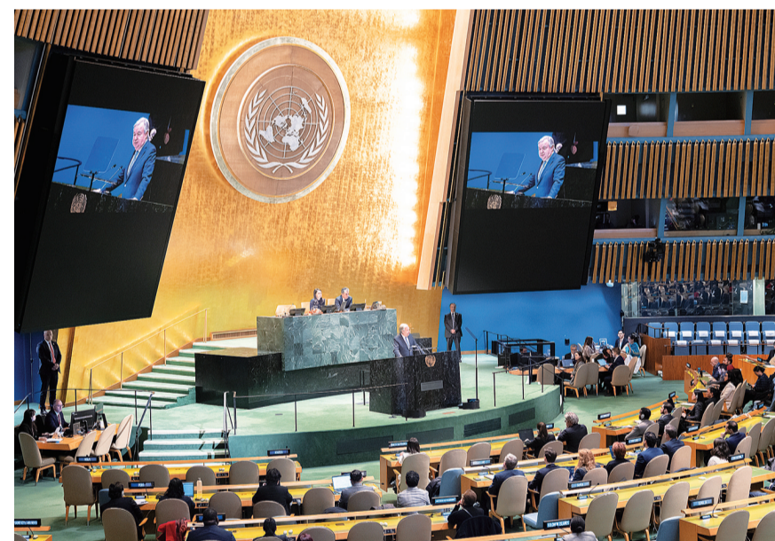
1月15日,在位于纽约的联合国总部,联合国秘书长古特雷斯(中)在联大全体会议上通报今年工作重点。