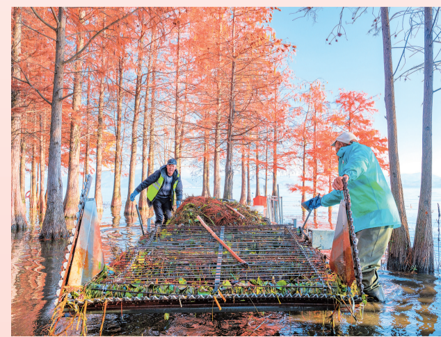
2025年12月26日9:50,洱海生态廊道2号观景台旁,两位环保人依托打捞船作业,收割岸边杂草和水生物。