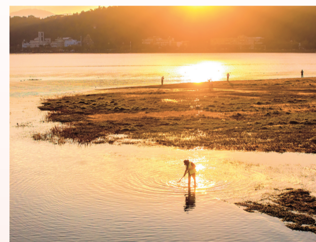
2025年12月26日8:30,太和街道葭蓬村洱海沿线,顺丰环保人迎着日出,涉水打捞岸边水草杂物,暖光映初心。