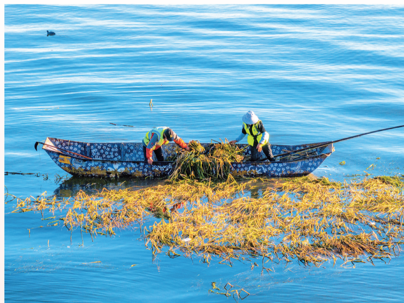
2025年12月14日9:30,龙龕码头附近,扁舟划破洱海碧波,顺丰环保人合力打捞水草,定格碧水间的坚守。

苍山如黛,洱海似镜。这片大理人的生态乡愁之地,澄澈碧波背后是无数守护者的耕耘。2025年,我用镜头追随顺丰洱海环保科技股份有限公司环卫工人的足迹,在朝露晴空下,于洱海岸边湖心间,定格他们与洱海相伴的一个个瞬间。这些光影画面,既是环保人日常的真实写照,更是洱海生态治理成效的生动注脚。