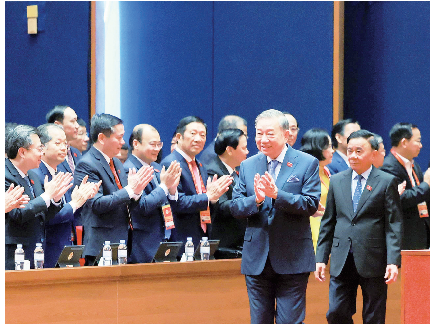
越南共产党第十四届中央委员会第一次全体会议1月23日在首都河内举行，苏林当选越共中央总书记。