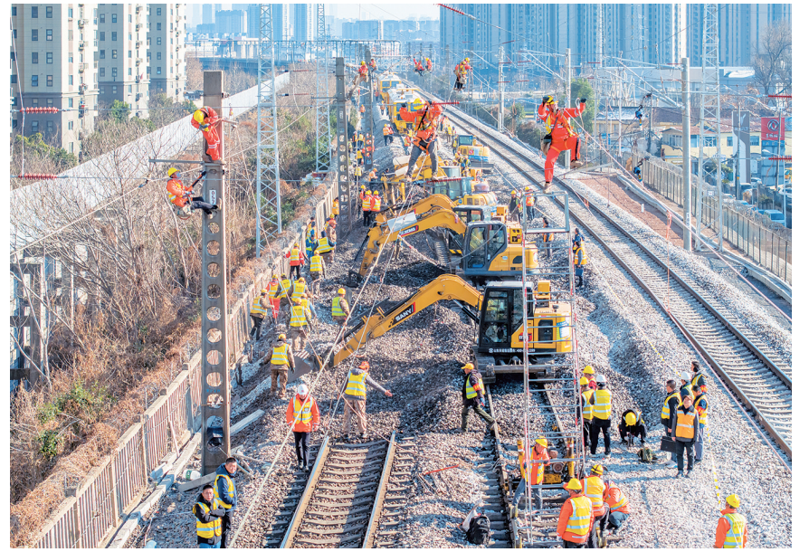
1月22日，在位于江苏省南京市浦口区的京沪线林场站，铁路工务、供电、电务等专业的职工在进行联合封锁施工作业。

1月22日，中国铁路上海局集团有限公司统筹组织运营和施工单位，联合对京沪线林场站进行了线路封锁施工。经过近千名施工人员进行协同作战、连续攻坚，京沪线引入南京北站枢纽第一阶段拨接施工顺利完成。