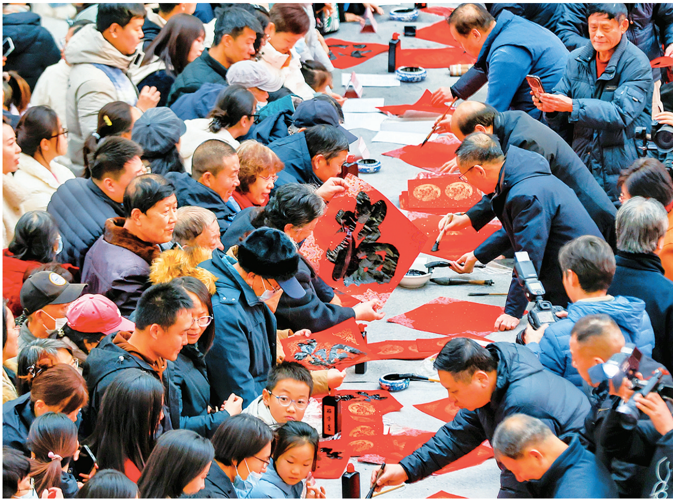
1月22日，文艺工作者在天津市滨海文化中心为市民现场书写春联和“福”字。

规划的开局之年，商务部将有效实施对外投资管理，健全海外综合服务体系，促进贸易投资一体化发展，支持企业开展国际化经营，深化数字经济、绿色发展等新兴领域合作，为世界经济稳定增长做出更多更大贡献。