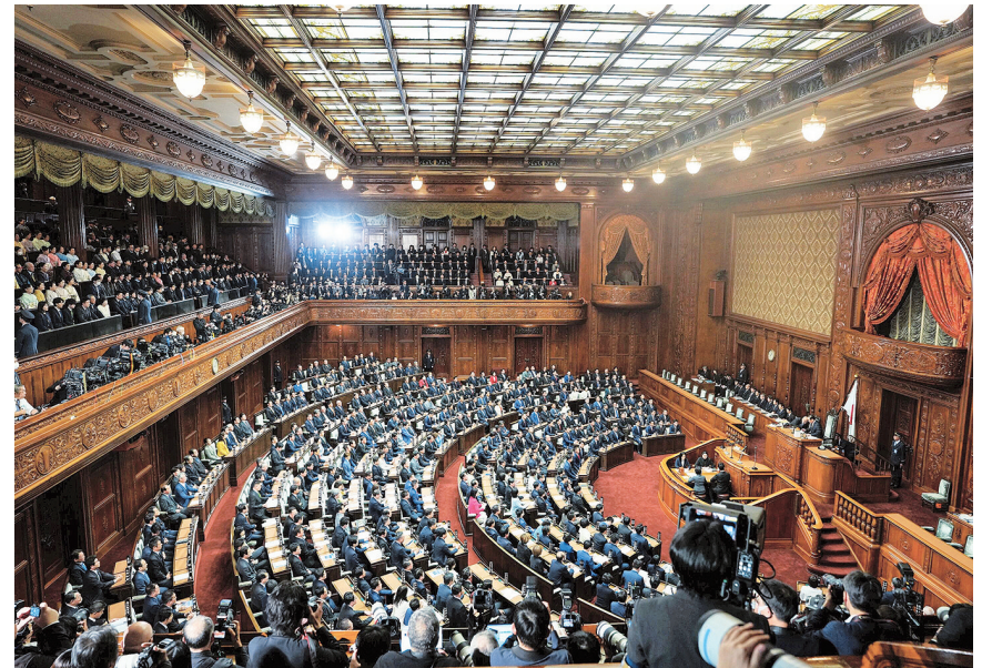
这是1月23日在日本东京拍摄的众议院全体会议现场。日本众议院议长额贺福志郎1月23日在众议院全体会议上宣读解散诏书，日本众议院正式解散。这也是日本众议院60年来首次在国会例会开幕日解散。