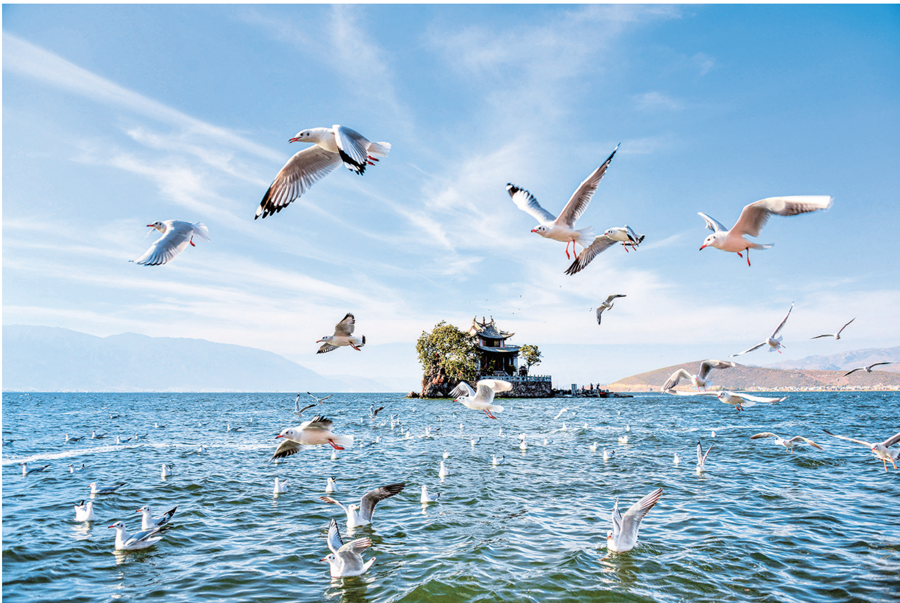
洱海小普陀。

——抓住关键，推动建议督办高质量。重点督办建议是推动代表建议办理落实的制度性安排，是发挥代表建议服务大局功效的重要抓手。经州人大常委会第55次主任会议研究，确定10件重点督办建议，由州人民政府分管领导领办，承办单位主要负责人负责落实，州人大常委会分管领导和相关专委会跟踪督办。承办单位分别成立办理工作领导小组，严格落实“一套工作专班、一个工作方案、一次联合调研、一场面商会议、一份情况报告”的工作程序，定人、定责、定时限、定工作标准。10件重点建议已全部办结，以重点建议办理的示范效应和典型带动作用，推动关系人民群众切身利益的问题得到重视和解决。