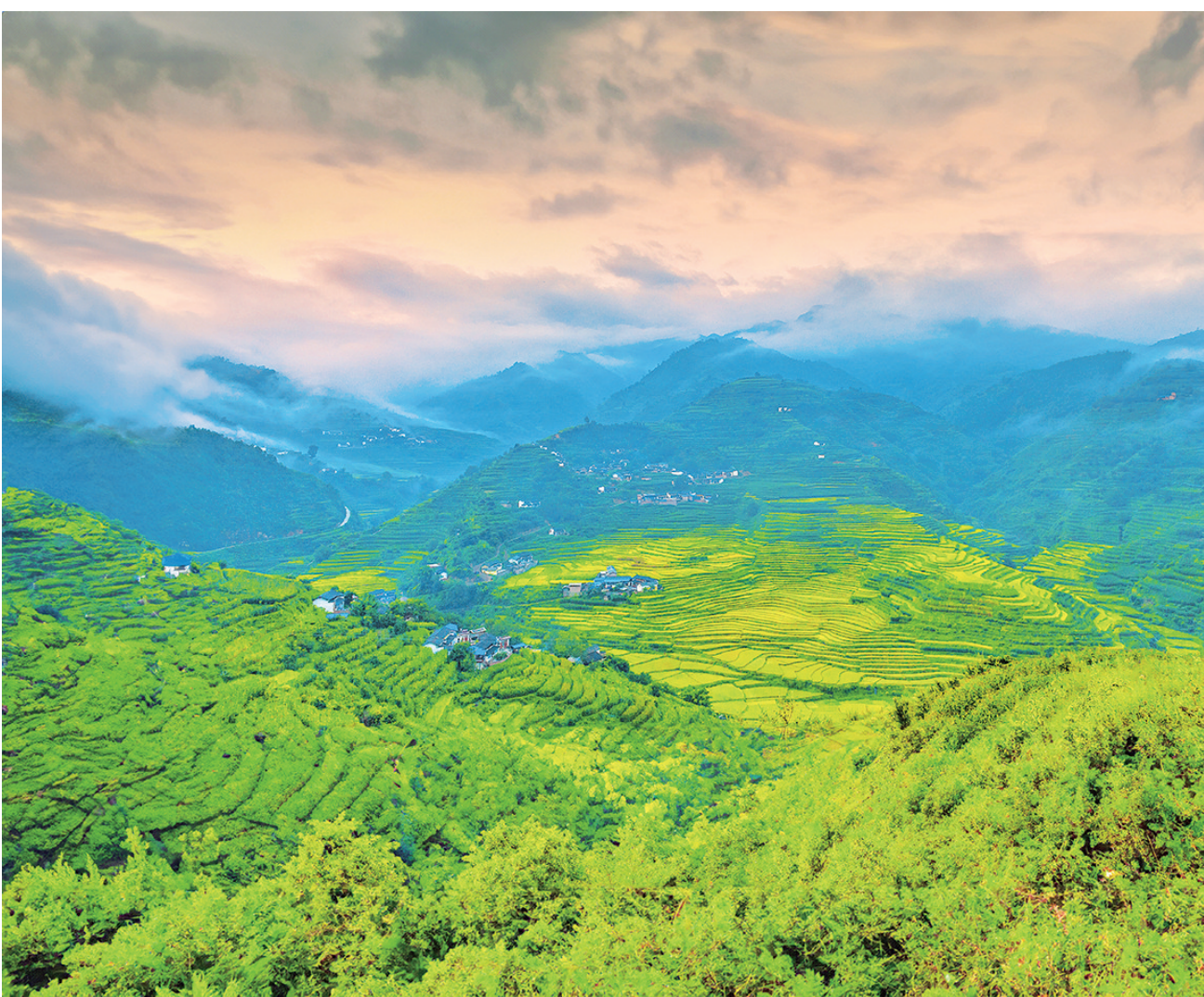
美丽山乡。