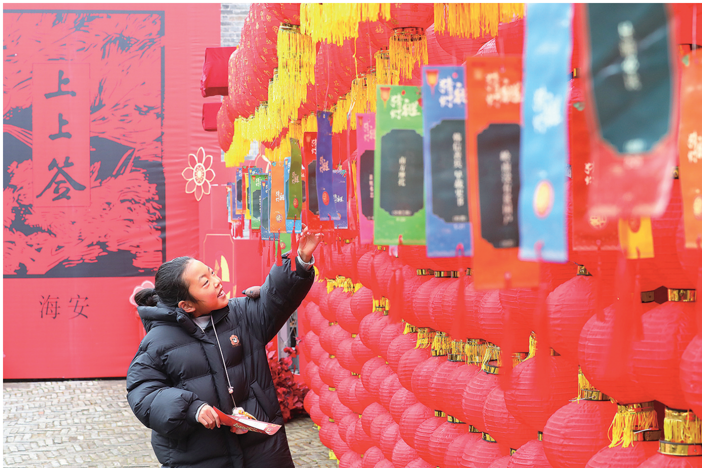
2月10日，小朋友在江苏省海安市博物馆(韩公馆)猜灯谜。