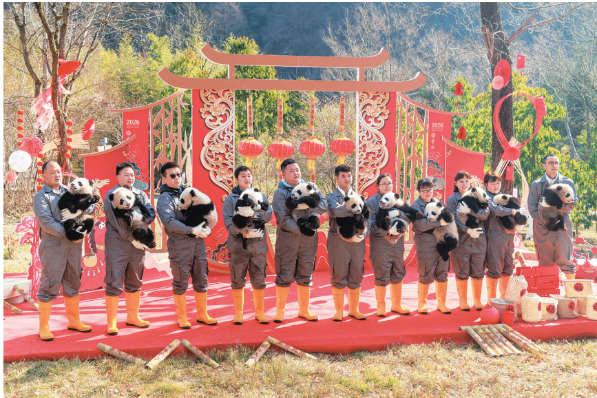
在中国大熊猫保护研究中心神树坪基地，饲养员带领2025级新生大熊猫幼崽亮相新春主题活动(2月5日报)。

近日，大熊猫国家保护研究中心举办“马上见国宝”新春主题活动，中国大熊猫保护研究中心和成都大熊猫繁育研究基地的30只2025级新生熊猫宝宝亮相，为大家送上新春祝福。据悉，2025年两大机构共成功繁育45只大熊猫。