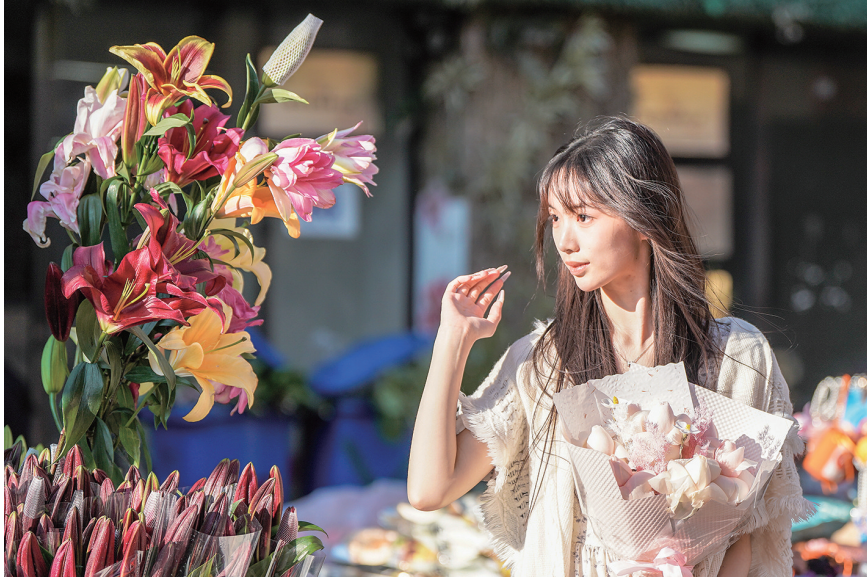
2月10日，游客在斗南花卉市场内选购鲜花。日前，在春节节日消费的带动下，被誉为“亚洲花都”的云南省昆明市斗南花卉市场迎来年宵花销售热潮。据了解，斗南花卉市场今年年宵花整体供货量较往年有所提升，在国内市场持续热销的同时，出口量也显著增长。