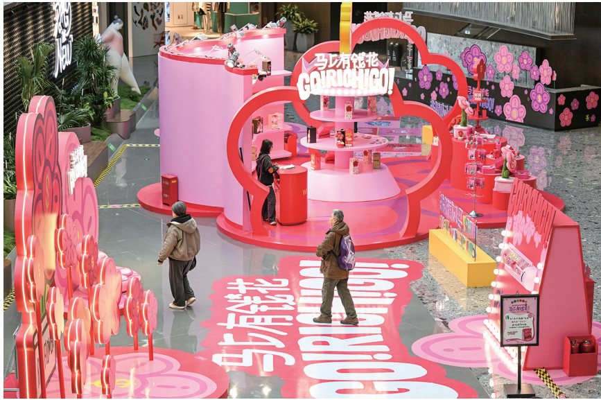
2月11日，顾客在北京西单商圈逛商场。国家统计局2月11日发布数据显示，1月份，居民消费需求持续恢复，全国居民消费价格指数(CPI)同比上涨0.2%，环比上涨0.2%，扣除食品和能源价格的核心CPI同比上涨0.8%。