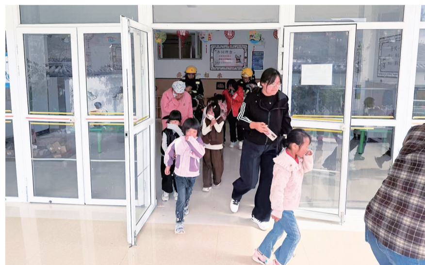
漾濞县富恒乡富恒幼儿园师生在乡消防队队员带领下进行消防安全演练。(摄于4月1日)当天,富恒乡专职消防队走进富恒幼儿园,开展“消防‘童’行,安全护航”消防培训演练活动。

据统计,当天共发放血吸虫病防治宣传资料及宣传用品800余份,咨询100余人次,开展流动人口免费查病37人次,为持续推进鹤庆县血吸虫病防治工作打下了坚实的群众基础。