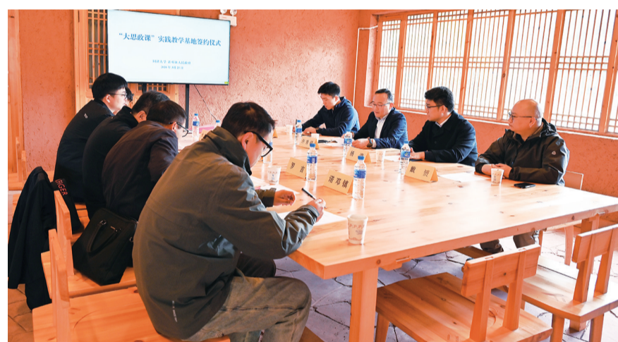
同济大学与云龙县诺邓镇人民政府在永安村举行“大思政课”实践教学基地共建签约仪式。(摄于3月25日)

2013年以来,同济大学定点帮扶云龙县,充分发挥学科、人才、资源优势,在产业、文旅、教育、医疗、人才、党建等方面倾力帮扶云龙,定点帮扶硕果累累。截至目前,依托“同济·云龙大讲堂”“云岭大讲堂”等平台,同济大学累计为云龙培训各类人才4314人次。