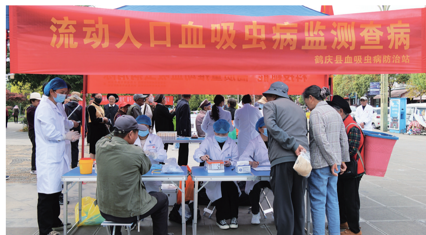
鹤庆县血吸虫病防治站工作人员在县城规划展示馆前广场开展血防宣传周现场宣传活动。(摄于4月7日)

据统计,当天共发放血吸虫病防治宣传资料及宣传用品800余份,咨询100余人次,开展流动人口免费查病37人次,为持续推进鹤庆县血吸虫病防治工作打下了坚实的群众基础。