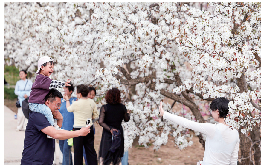
4月11日,游客在甘肃省兰州市皋兰县什川镇百年梨园内踏青赏花。近日,甘肃省兰州市皋兰县什川镇百年梨园内梨花怒放,吸引市民游客前来踏青赏花,感受浓浓春意。