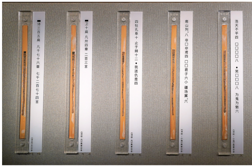
这是4月13日在江西南昌汉代海昏侯国遗址博物馆拍摄的《诗经》简。

与齐《论语》同批上新的还有:在汉代既是文学经典又是重要“读书”的《诗经》简,其上“诗三百五篇凡千七百七十六章七千二百七十四言”的文字,实证海昏侯《诗经》在随葬时为全本《诗经》;记录棋盘局势和行棋口诀的《六博》简,展现了王侯贵族的休闲娱乐生活;墓中总共