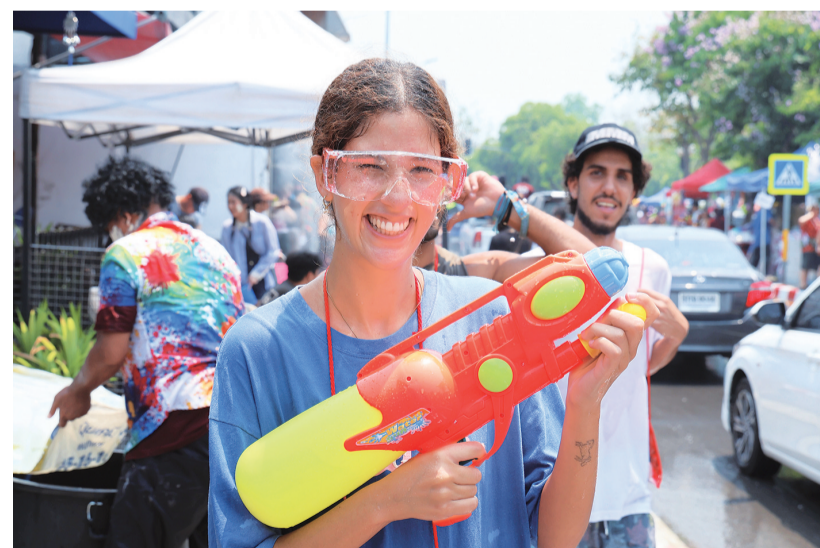
4月13日,人们在泰国清迈街头参加泼水节庆祝活动。

每年4月13日至15日是泰国传统新年宋干节,也称泼水节,人们以互相泼水的方式表达迎新祝福。