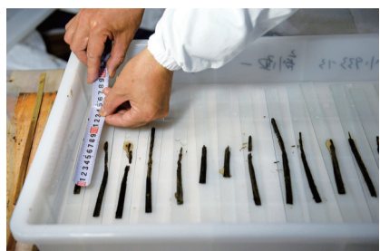
2015年11月24日,考古文保人员在位于江西南昌的海昏侯墓遗址文保用房内对出土的竹简进行剥离(资料照片)。

由齐地儒生传述,较其他版本多出《问王》《知道》(即《智道》)两篇,但在汉魏时期逐渐失传。海昏侯墓出土齐《论语》,对于全面认识儒家思想演进及研究西汉思想史具有重要意义。