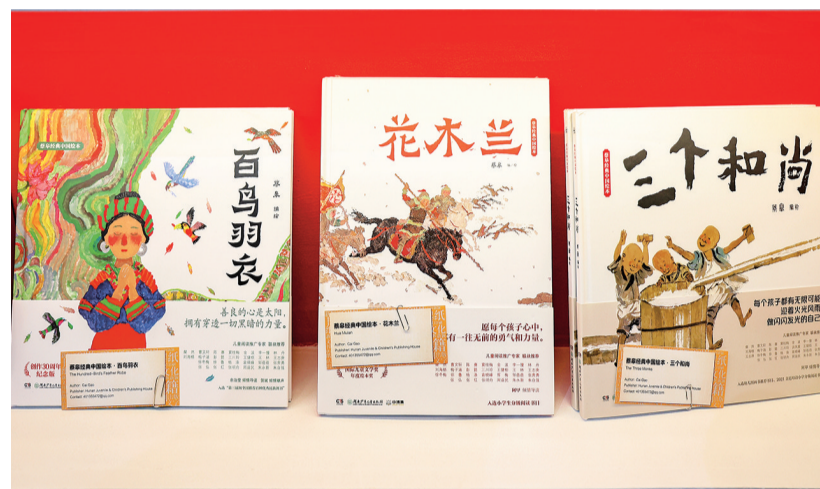
这是4月13日在意大利博洛尼亚举行的博洛尼亚国际童书展上拍摄的中国艺术家蔡皋的作品。

4月12日,智利2026年国际航空航天展在圣地亚哥首都大区普达韦尔开幕。航展4月11日和12日面向普通观众开放。