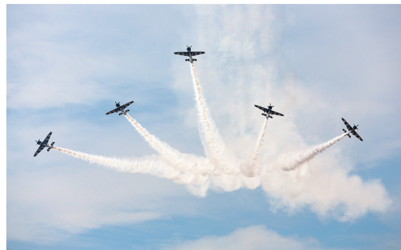
这是4月12日在智利圣地亚哥首都大区普达韦尔举行的2026年国际航空航天展上拍摄的飞行表演。

赛事将录取各组别前8名,并评选体育道德风尚奖、优秀组织奖及优秀运动员、教练员、裁判员,推动大理州校园篮球氛围持续提升,助力体教融合与青少年体育事业高质量发展。