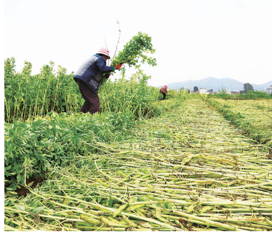
祥云县祥城镇下村村民在田间收割蚕豆。(摄于4月14日) 连日来,祥云县春耕春种齐头并进,各地村民抢抓农时,在田间地头忙碌穿梭,绘就了一幅不负春光、实干兴农的画卷。