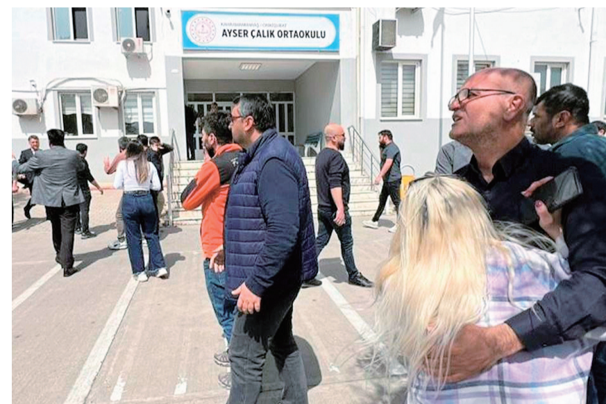
4月15日,人们聚集在土耳其卡赫拉曼马拉什省发生枪击事件的中学校园等待消息。据土耳其私营的NTV电视台15日报道,土东南部卡赫拉曼马拉什省一所中学当天发生的校园枪击事件已造成9人死亡、13人受伤,凶手已自杀身亡。