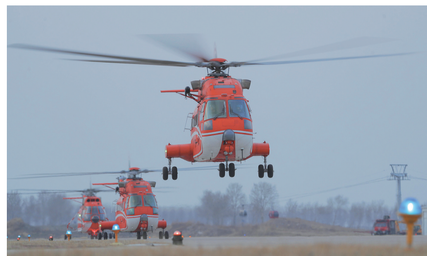
4月15日拍摄的国家消防救援局大庆航空救援支队跨昼夜救援演练现场。4月15日,国家消防救援局大庆航空救援支队多架救援直升机在黑龙省大庆市依次升空,围绕暗舱仪表进近、暗舱航线等开展跨昼夜飞行训练,锤炼队伍全天候、全时段执行应急救援任务的本领。