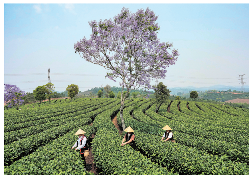
4月15日,茶农在普洱市思茅区倚象镇的茶山采摘春茶。近日,云南省普洱市思茅区迎来春茶采摘季。茶农忙碌在层叠起伏的茶山间,绘就一幅春日美好画卷。