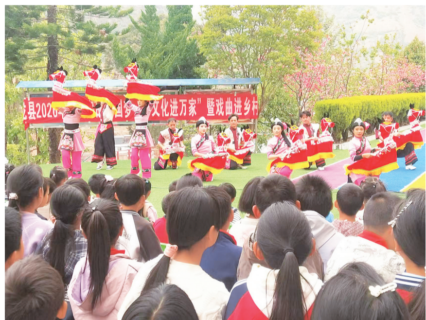
云龙县吹腔艺术团走进诺镇永安完小开展2026年“我们的中国梦——文化进万家”暨戏曲进乡村、文化惠民演出活动。(摄于4月15日) 近期,云龙县文化馆、云龙县吹腔艺术团陆续到全县12个乡镇开展文化惠民演出。活动的开展,极大地丰富了乡村群众的精神文化生活,深受群众欢迎。