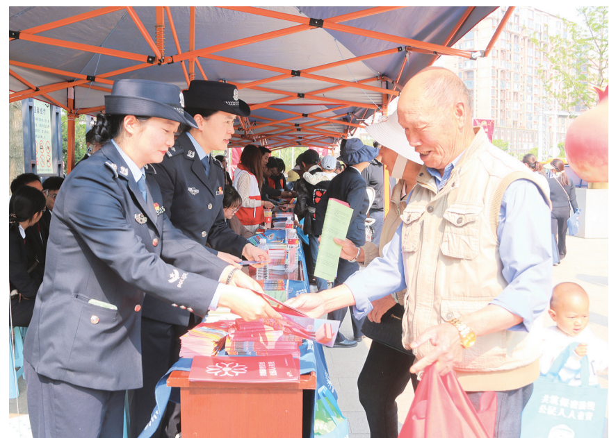
祥云县公安局民警向市民发放个人信息安全宣传折页。(摄于4月15日) 近年来,祥云县持续开展网络信息安全宣传,不断提升居民个人信息保护意识和防护技能水平,防范信息泄露与网络诈骗风险,筑牢个人信息安全“防火墙”。