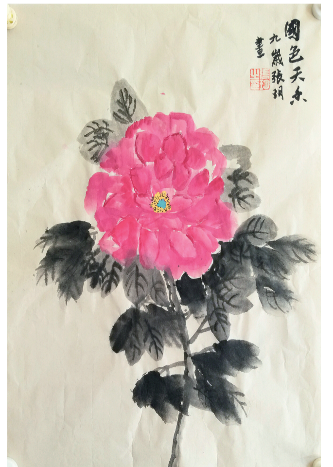
张明(三年级 祥云麒麟书院) 绘画作品《国色天香》