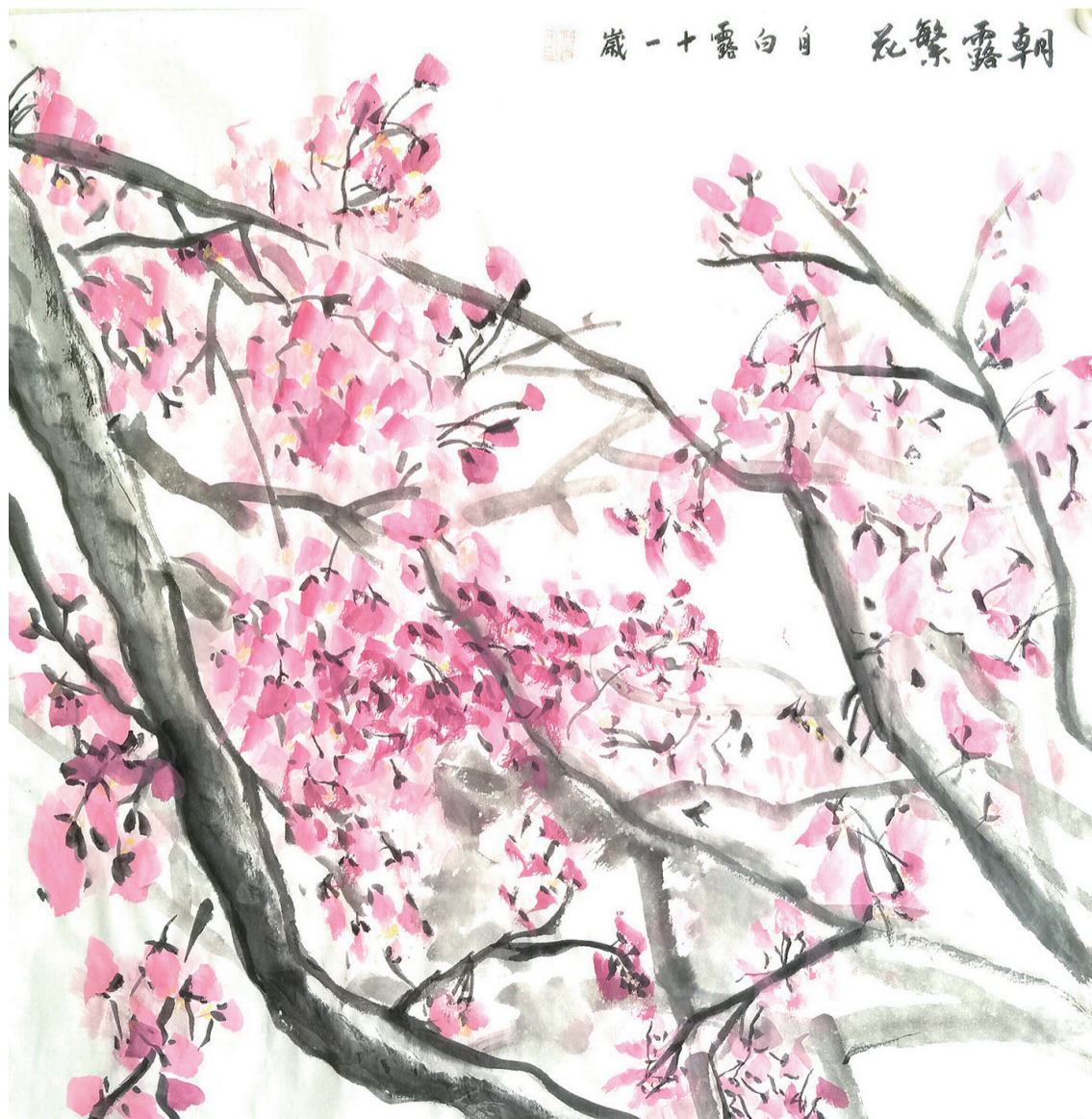
白白露(五年级 祥云麒麟书院) 绘画作品《朝露繁花》