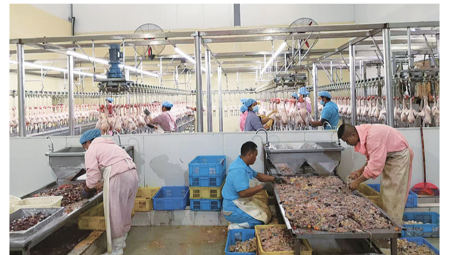
南涧乘炎农牧食品开发有限责任公司员工在生产线上有序作业。