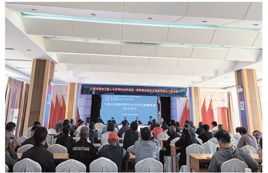
大理州南涧无量山乌骨鸡产业科技特派团开展健康养殖技术培训。