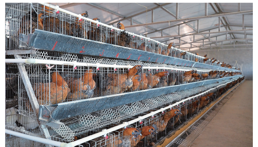
南涧县兴云农业开发专业合作社乌骨鸡标准化养殖基地。