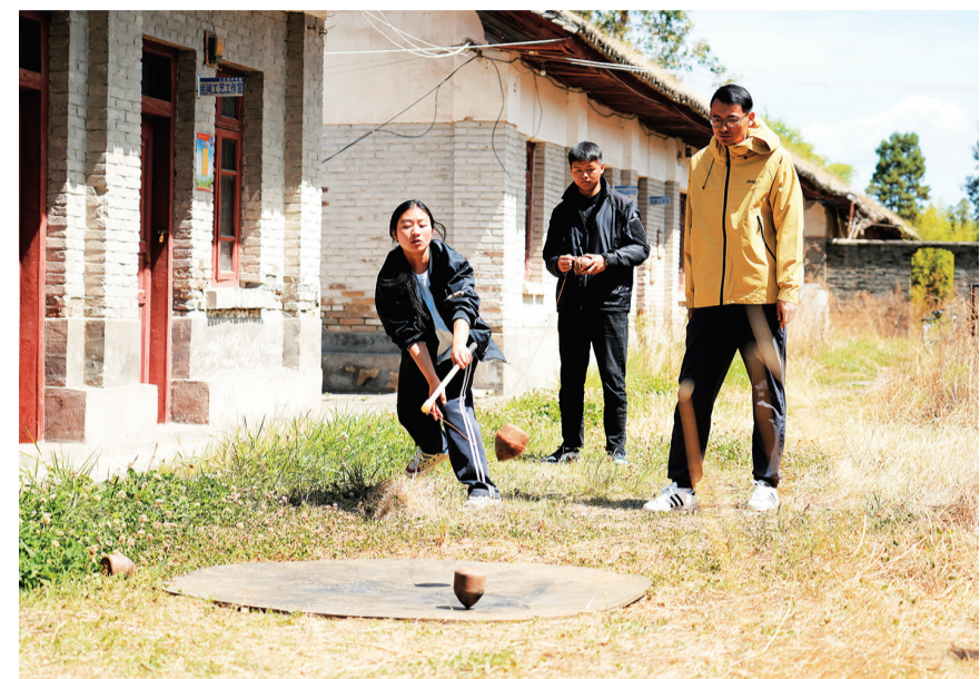
参加大理州第27届少数民族传统体育运动会的剑川选手正在刻苦训练。(摄于4月23日)

本报讯(通讯员 杨毅 赵军文/图)连日来,剑川县参加大理“三月街”民族文艺演出的参演人员及大理州第27届少数民族传统体育运动会的参赛选手正在精心排演、刻苦训练,全力备战“三月街”民族节系列比赛活动。