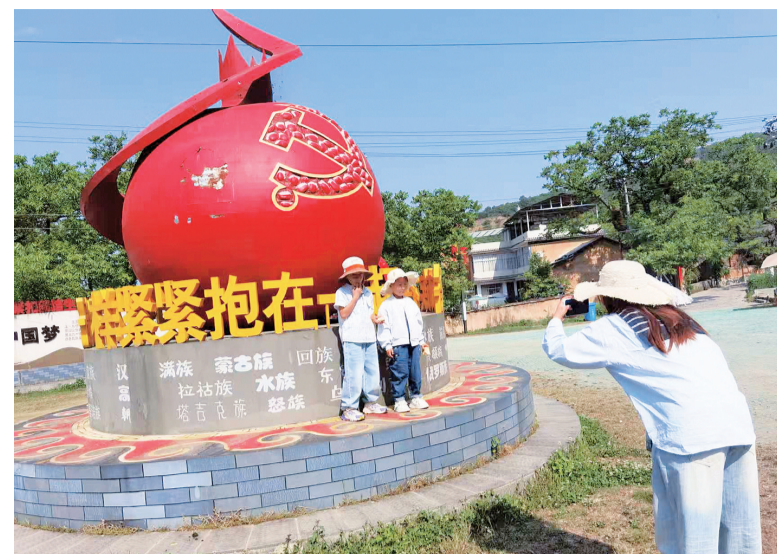
一位家长带着孩子春游时,在漾濞县云上村的民族团结“石榴籽”雕塑前打卡拍照。(摄于4月25日)

该俺老猪出场了。这几年我的家族不断壮大,和大家共同生活在一片林子里,热热闹闹的!请大家善待我们,和平共处嘛。