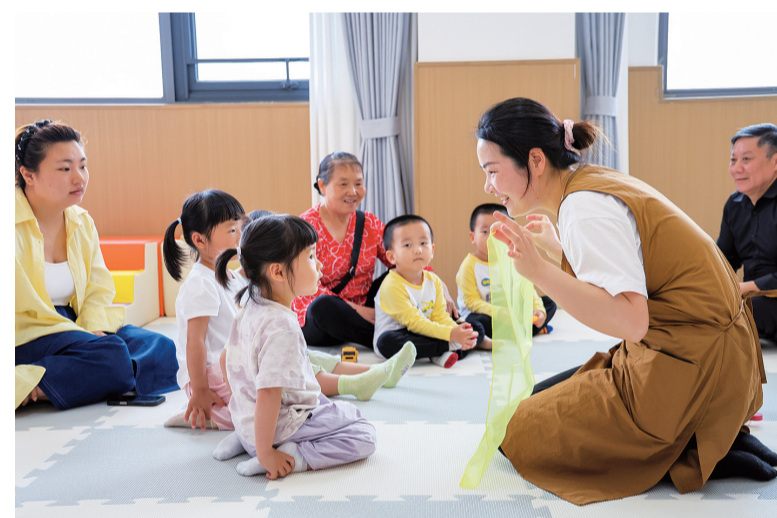
4月15日,在深圳市龙华区民治街道民康社区“一老一小”综合服务站,恩乐儿托育园的老师在陪孩子们做游戏。

深圳是一座年轻的城市,居民平均年龄32.5岁。为了让适龄备孕人群把“想生”变成“敢生”,如今的深圳,育儿正从家庭内部接力的“马拉松”逐渐转向政府搭台、社会共建、专业支撑的系统性探索,一个覆盖宝宝最初1000天的“15分钟托育圈”正加速编织。