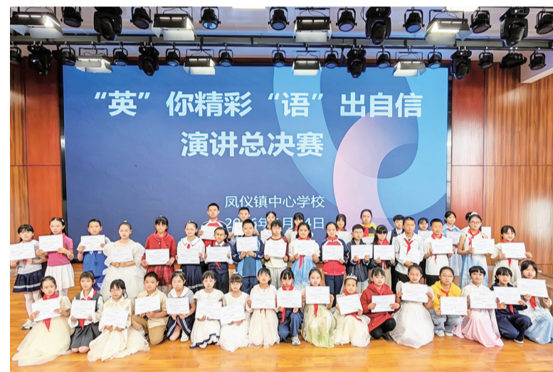
大理市凤仪镇首届小学英语演讲比赛活动现场。(摄于4月24日)

当天,来自全镇12所小学的53名选手,用自信的英语表达展现了乡村少年的风采。经过紧张激烈的比拼,评委组评出各年级组一二三等奖和优秀奖选手。比赛有效激发了小学生的英语学习热情,提升了语言表达能力,促进了农村教育的多元发展。