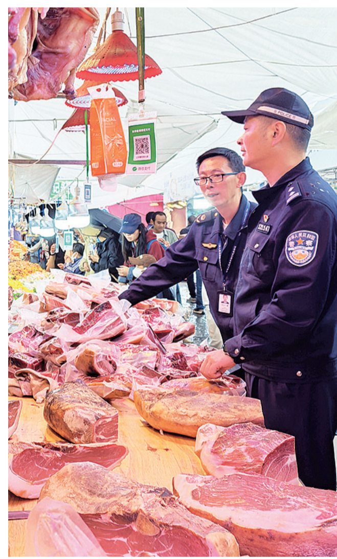
▶ 工作人员在三月街街场开展食品安全检查。(摄于5月3日) 大理市公安局环食药侦大队联合市场监督管理等部门,组成专项检查组,对街场内外的土特产销售点、餐饮摊位、超市、药品销售点等进行检查。针对检查中发现的安全隐患,现场提出整改意见,并督促立即整改到位,从源头防范食药安全风险。同时,将普法宣传阵地前移至三月街街场一线,向广大经营者与消费者普及食品药品安全相关法律法规。