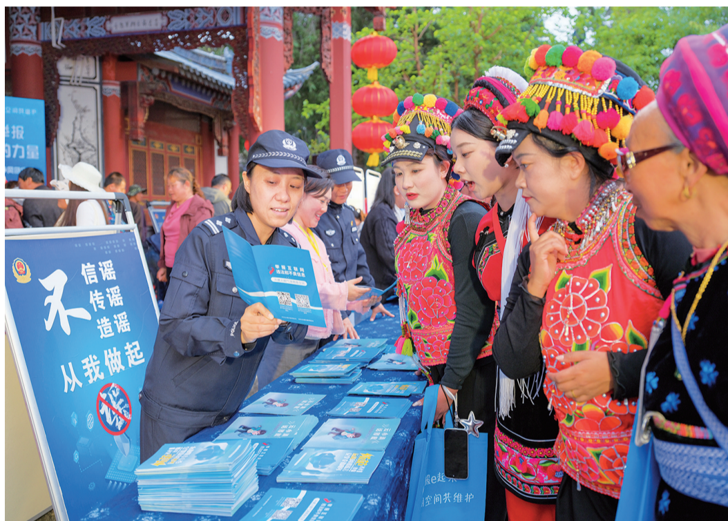
▲ 大理州网络举报、辟谣宣传进三月街活动现场,工作人员向群众开展宣传。(摄于5月1日) 活动由省网信办举报中心、州委网信办、州公安局网安支队、大理市委网信办主办,通过在三月街街场发放举报指南、设置互动游戏体验区、网络直播等形式,向广大群众和游客普及网络谣言危害与举报渠道,助力营造清朗网络空间。

调度中心实时监测客流,动态调整发车频次;维修班组全天候待命……各部门紧密锣鼓、密切配合,坚守各自岗位,让“旅客不滞留、服务不降档”不是口号,而是实实在在地温暖每一程归途。