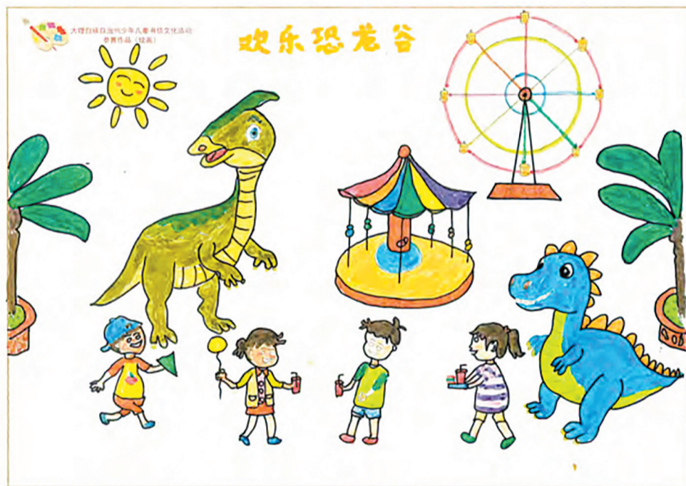
自语诗(祥云县祥城镇城东社区幼儿园)