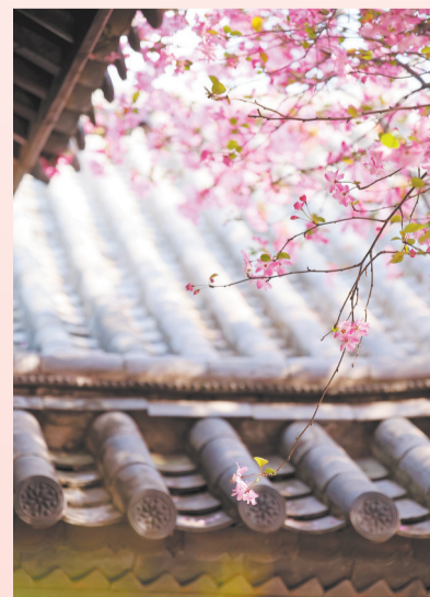
《檐下海棠春》——剑川县金华镇西门街海棠别墅垂丝海棠