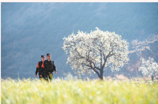
《梨园春巡》——剑川县金华镇桑岭村田园、梨花