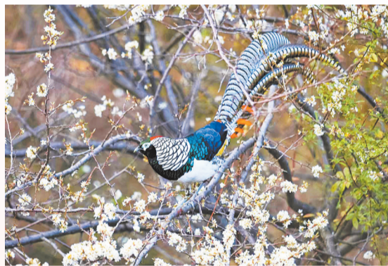
《锦鸡戏花》——剑川县千狮山白腹锦鸡