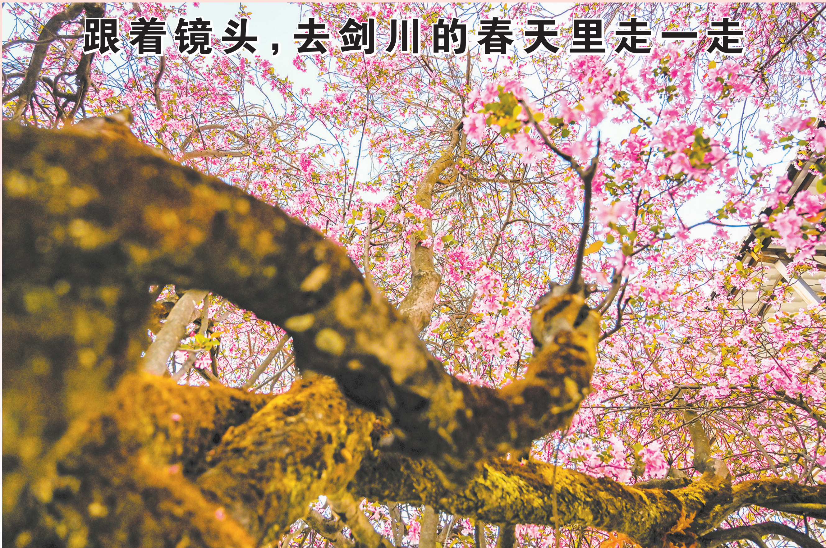
《古树逢春》——剑川县金华镇西周官村百年海棠