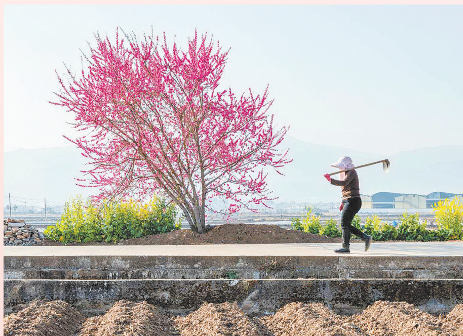
《桃花盛开春耕忙》——剑川县甸南镇西中下村桃花盛开