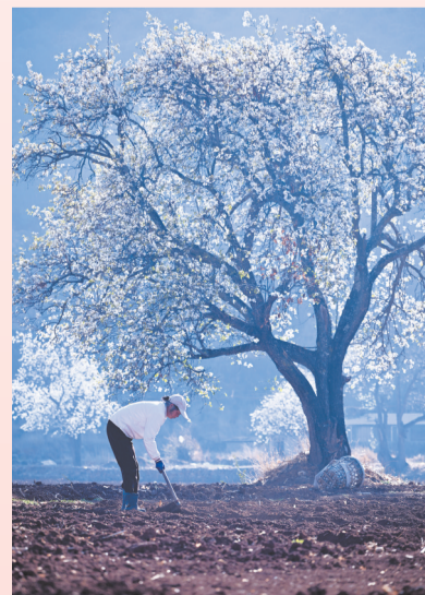
《梨园耕读》——剑川县金华镇桑岭村梨园春耕