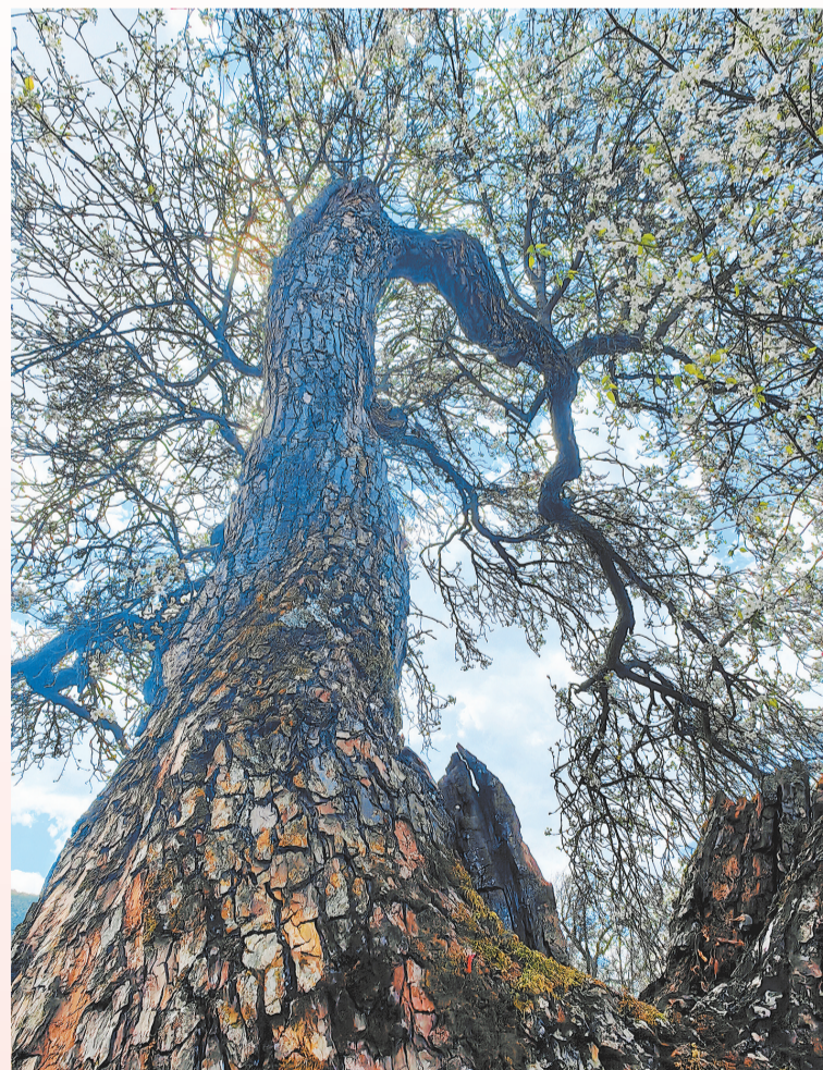
《春风》——剑川县甸南镇南山梨园梨花