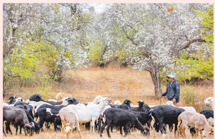
《牧》——剑川县甸南镇回龙村梨园牧羊