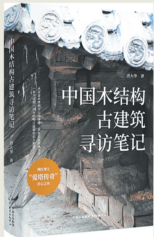
《中国木结构古建筑寻访笔记》 唐大华 著 东方出版中心·耕泽文化 2026年3月出版

从“蛟龙”探海到深潜万米，中国人深潜事业20年间完成从追赶领跑的历史性突破。这部纪实作品以叶聪和团队的奋斗历程为核心，全景还原了全海深载人潜水器谱系化研制的整个过程，展现了科研工作者在深海险境中以自主创新攻克壁垒、以使命担当铸就重器的执着坚守。作品兼具严谨科学与鲜活叙事，彰显了我国科研人员的创新气魄与家国情怀，勾勒出中国迈向海洋强国的坚实足迹。