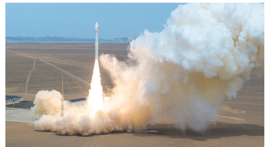
5月15日12时33分，我国在东风商业航天创新试验区使用力箭一号遥十三运载火箭，成功将泰景三号05A/05B星、天仪50星、天雁27星、吉林一号高分03D55星共5颗卫星发射升空，卫星顺利进入预定轨道，发射任务取得圆满成功。