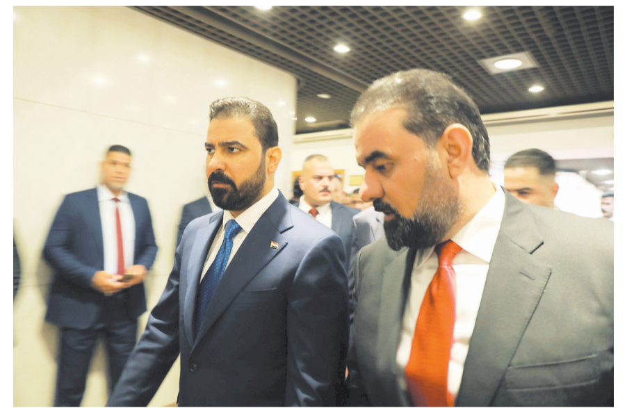
这是5月14日在位于伊拉克首都巴格达的议会拍摄的伊拉克新任总理扎伊迪（前左）和国民议会议长哈勒布西（前右）。

发布仪式现场播放了“最美家庭”先进事迹的视频短片，多角度讲述了他们的家庭故事。中央宣传部、全国妇联负责同志为他们颁发“最美家庭”证书。