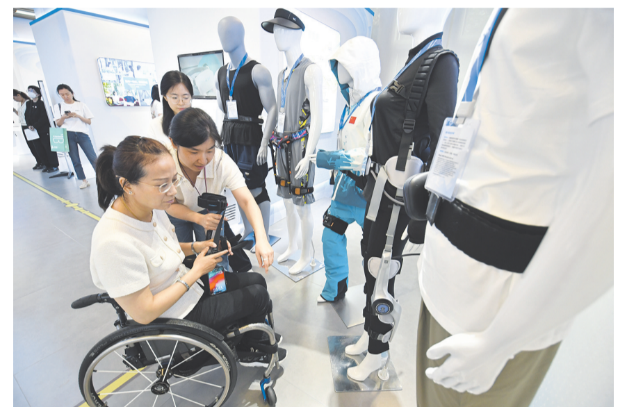
5月15日，技术人员为残疾人介绍外骨骼设备。

5月15日，一场科技助残体验活动在北京汇爱大厦举行。活动中展示了“畅行、畅听、畅视、畅心、畅想”五大领域的60余项科技助残成果，包括智能导盲犬、外骨骼机器人、AI字幕眼镜、智能仿生手、AR康复系统、脑机接口等前沿科技产品，传递科技赋能残疾人体的美好愿景。