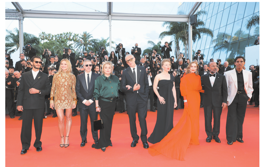
5月14日，在法国戛纳，导演阿斯拉·法哈德（右二）等主创人员亮相主竞赛单元影片《平行故事》的首映式红毯。